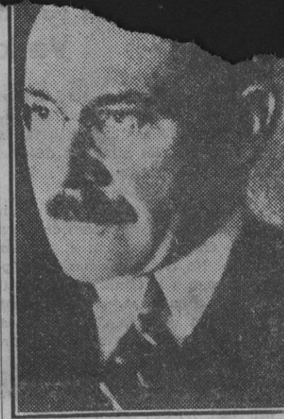
El nuevo presidente del Gobierno checo, doctor Milán Hodza.

Todos estamos interesados en que se haga algo práctico, y la primera beneficiada la Escuela de Artes y Oficios. De no entenderlo así, lo más sencillo hubiera sido pedir para esa Escuela un gran Palacio ad hoc, en la seguridad de que por muchos años continuaría en su reducida instalación actual, esperando la llegada del palacio "hechizado".