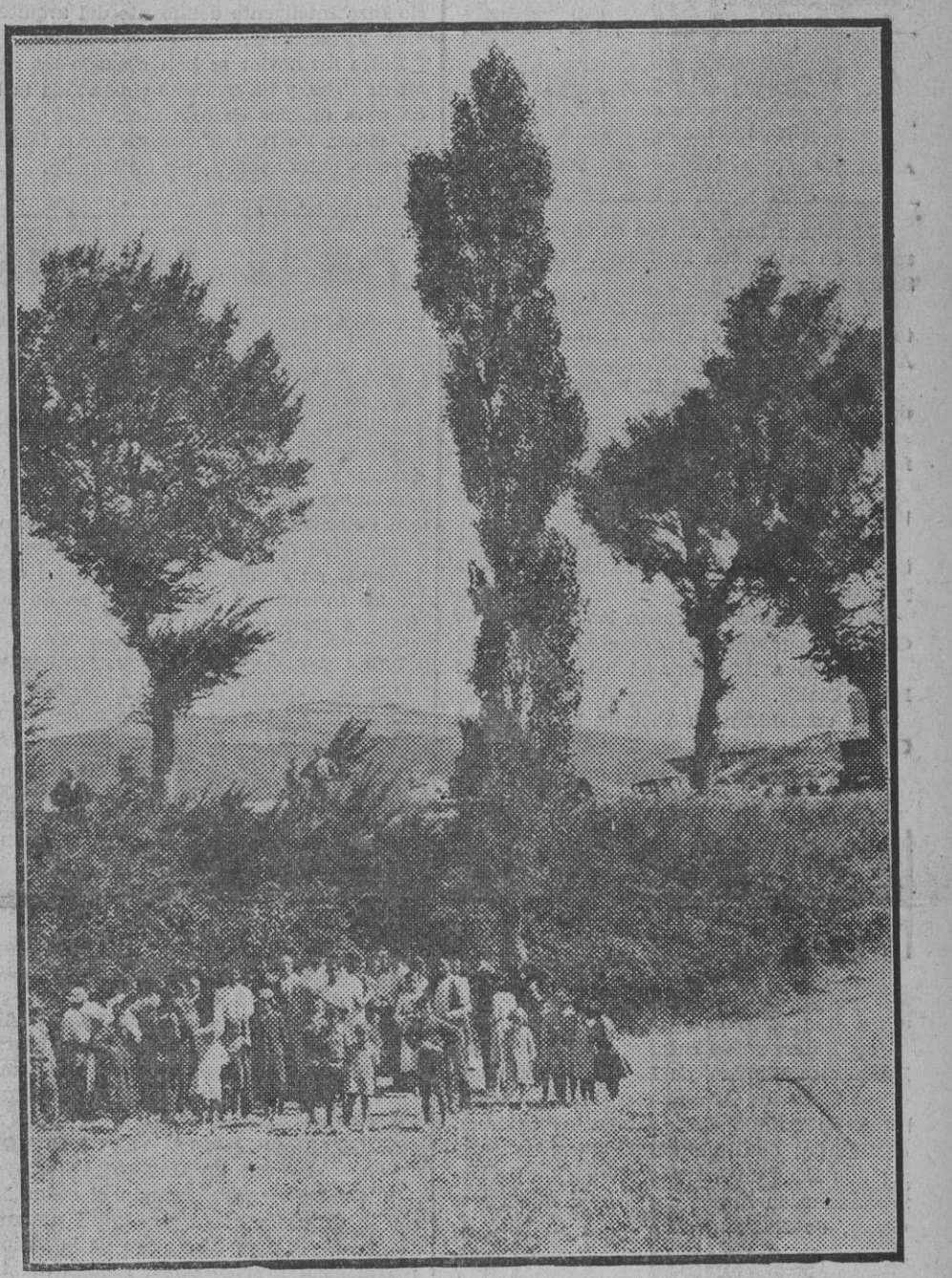
Los matorrales entre los que fué abandonada y hallada la arqueta. Los cascos que se ven son de Berrioplano. Al fondo se advierte San Cristóbal.

Esta no ha podido tener más feliz resultado. Como lo pensaron lo hicieron: padre e hijo, muy de madrugada, se trasladaron a la pieza en la cual fué encontrada la palanqueta, realizando un detenido reconocimiento. Al borde de la pieza y tocando a la carretera de Guipuzcoa existen unos frondosos matorrales. Este terreno se encuentra en un desfiladero con relación a la carretera de unos tres a cuatro metros, y entre dicha maleza se encontró un bufo cubierto con una gabardina y fuertemente atado con