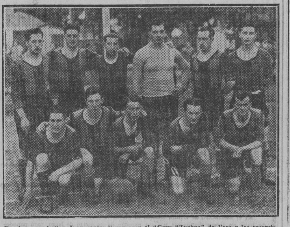
En el campo de San Juan contendieron ayer el "Gure Txokoa" de Vera y los reservistas de Osasuna. El partido terminó con la victoria de los "rojillos" por 4 a 2. En el equipo veratarras que es el que aparece en el foto destacó sobremanera el extremo derecho, un "mozo" de mucho porvenir que mereció la atención de los expertos en "caza". Resultó un partido interesantísimo y muy bien jugado por ambos bandos, sobre todo por los delanteros.