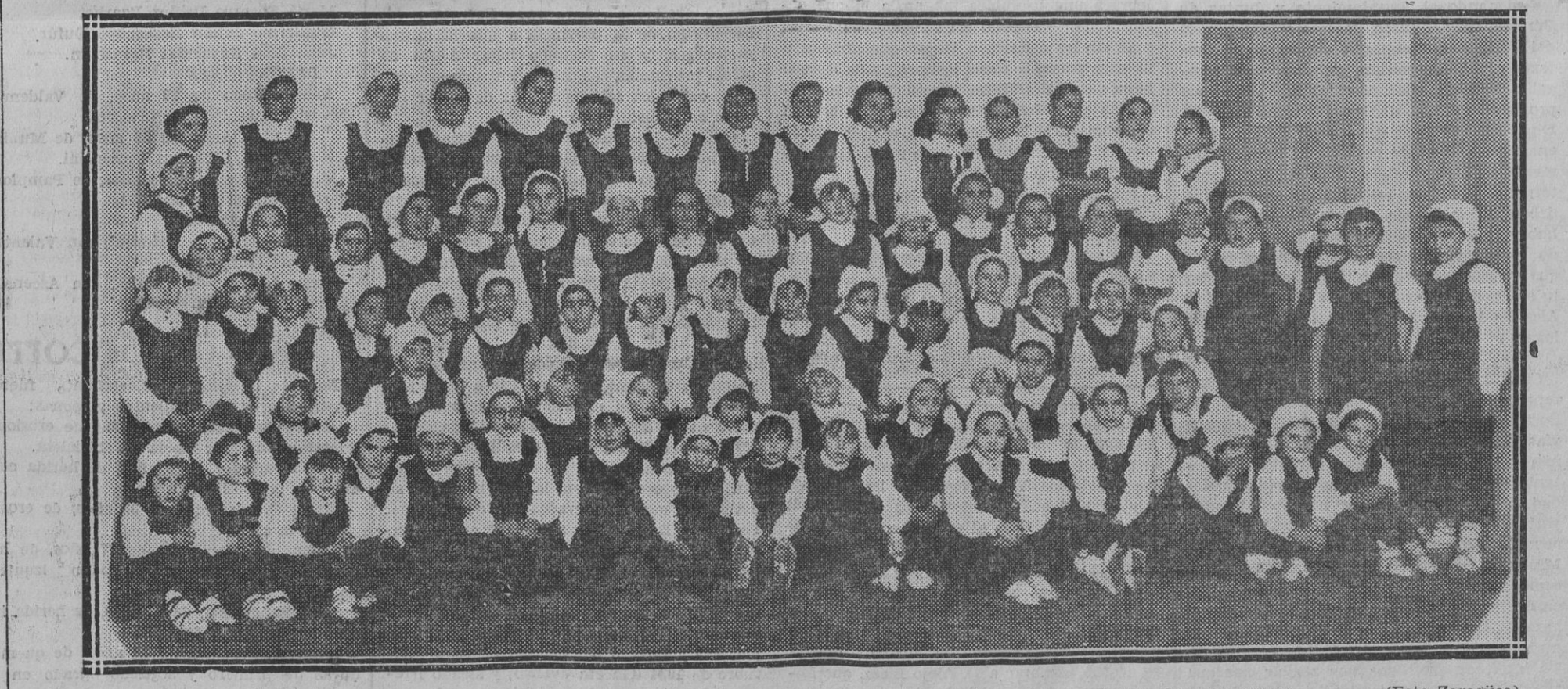
Los pexpoliñas de Iruña que tan bello y gráfimo espectáculo ofrecieron el domingo con sus inocentes y alegres danzas vascas