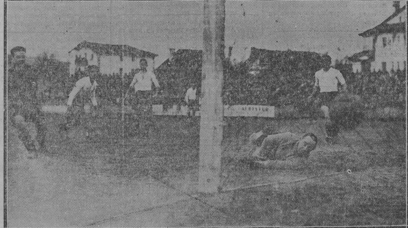
Emory a pesar de su estirada no tiene más remedio que resignarse a ver alejado el segundo gol en su red. Lo mira con tal desconsuelo que inspira lástima... pero la cosa no tiene ya remedio. En cambio los "hinchas" de Osasuna ponen cara de satisfacción.

y Tellería, así como los de la camioneta, todos ellos mejoran notablemente.