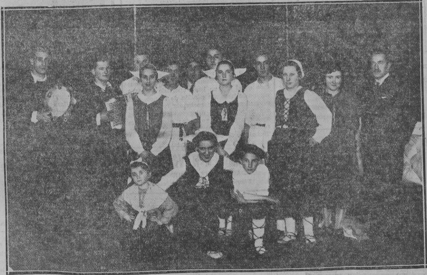
Gaztetxus de Guipuzcoa que tomaron parte en el festival del Euskal Jai y que fueron objeto de muchas y cariñosas ovaciones por su admirable actuación.

Se ruzga a todas las voces de esta Juventud que hoy a las 8 de la noche darán comienzo los ensayos de cantos vascos a varias voces y que por lo tanto deberán acudir para la hora indicada.