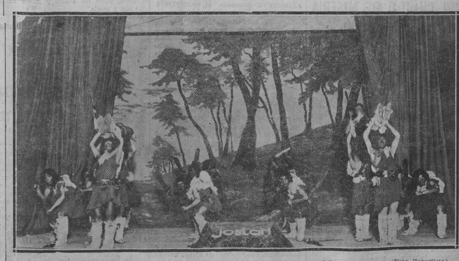
Momento culminante de la ezpata-danza que se ejecutó ayer en el Gayarre entre aplausos delirantes.