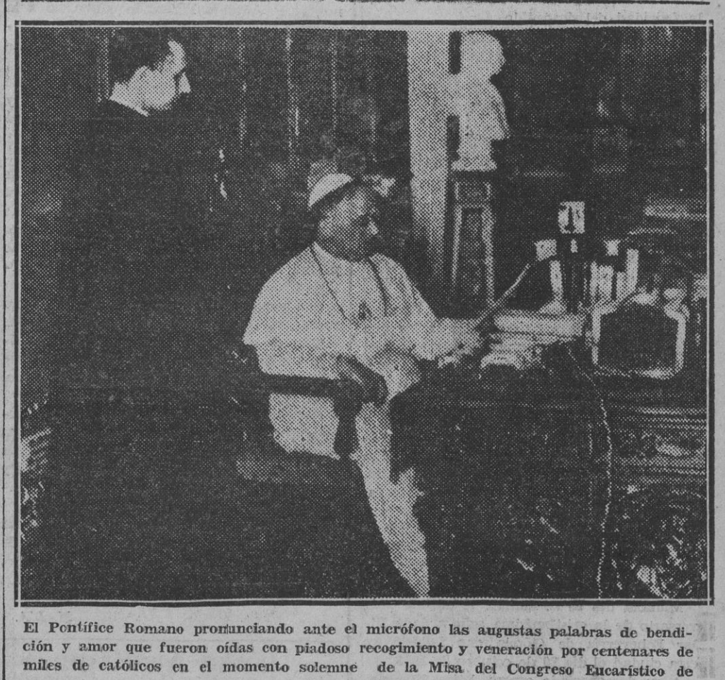
El Pontífice Romano pronunciando ante el micrófono las augustas palabras de bendición y amor que fueron oídas con piadoso recogimiento y veneración por centenares de miles de católicos en el momento solemne de la Misa del Congreso Eucarístico de Buenos Aires