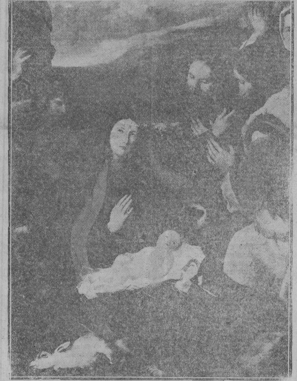
ESCENA DEL NACIMIENTO DEL SALVADOR. LA ADORACION DE LOS PASTORES (Cuadro de Riberá)

Así ha venido sucediendo desde hace siglos. Quiera, Jesús, Redentor, que no se rompa jamás la alianza de nuestro caserío, todo es, de la familia vasca, con el cielo.