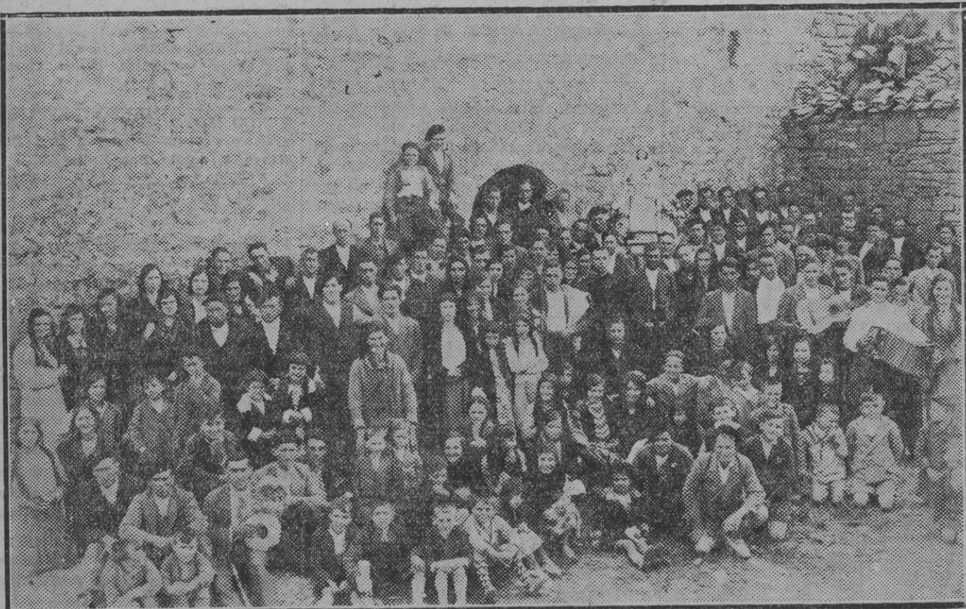
Los romeros de Ech arren, al salir de la función religiosa en la Ermita de Gorriza.