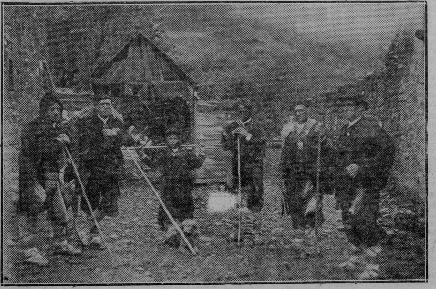
Un grupo de pastores salacencos