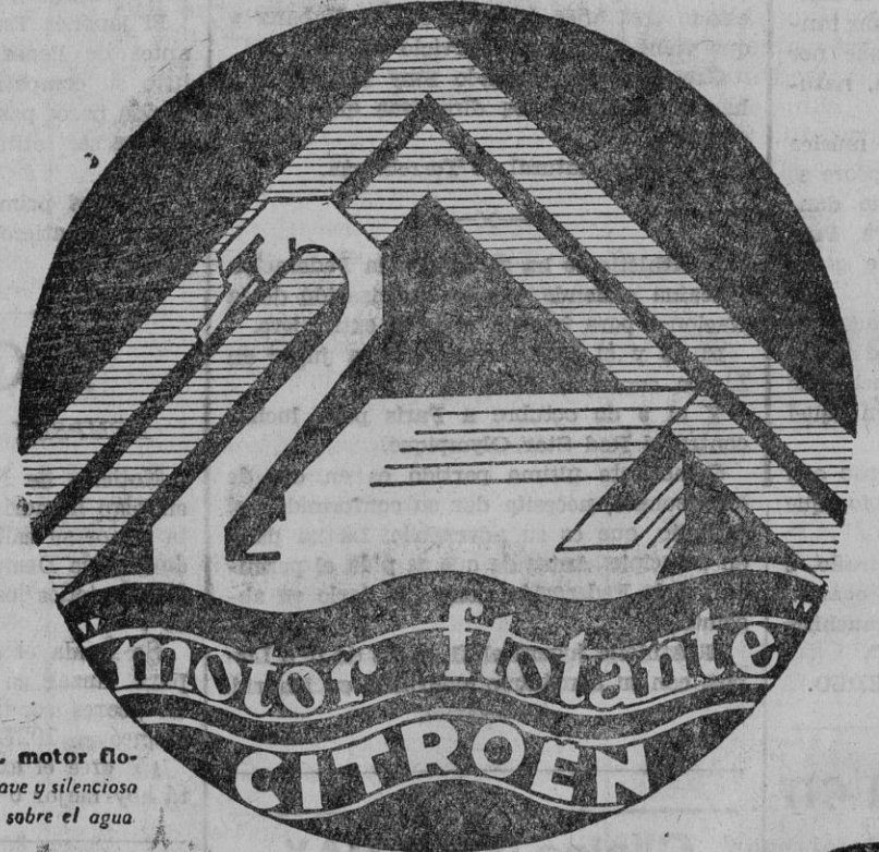
SIMBOLO DEL motor flotante: Marcha suave y silenciosa como la del cine sobre el agua