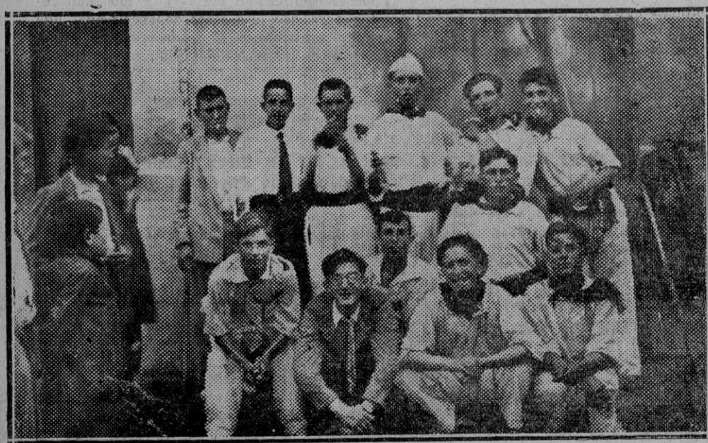
Cuadrilla de mozos que han amenizado las fiestas

Vertical text on the right edge of the page, likely a page number or index reference.