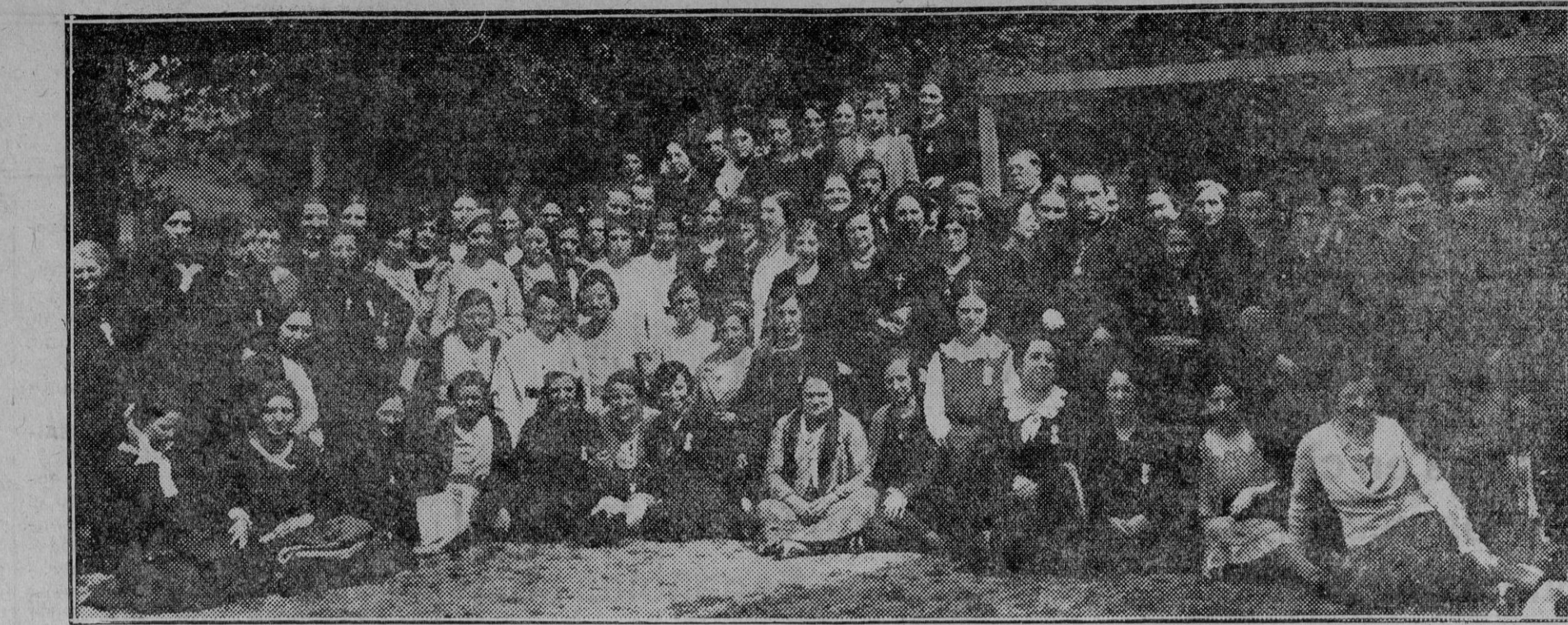
Miembros de los Jueves Eucarísticos que hicieron el domingo una excursión a Lecumberry, de la que volvieron muy complacidos.

Otro día seremos más explícitos sobre este particular. El Corresponsal. 1 Agosto 1932.