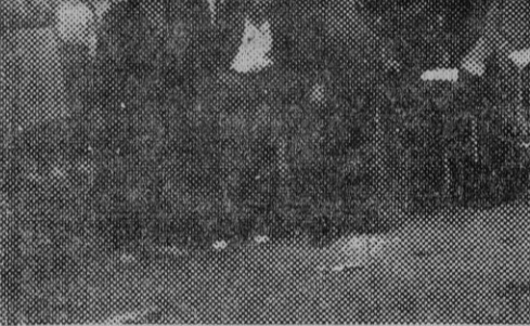
La comparsa de Gigantes y Cabezudos con la banda municipal y dulzaineros