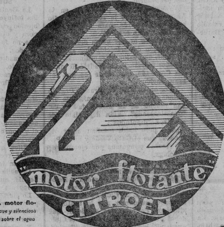
SIMBOLO DEL motor flotante: Marcha suave y silenciosa como la del cisne sobre el agua