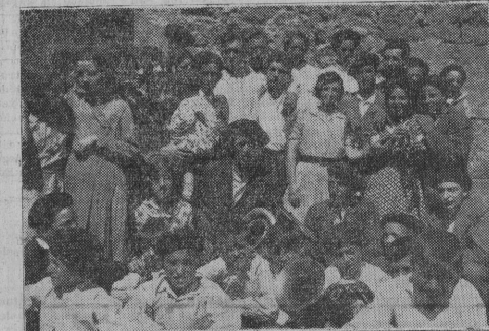
DE YABAR.—Un grupo de jóvenes de los que más se han divertido durante las fiestas recientemente celebradas.

Vino, 3.000 decálitros. Vinagre, 500 idem. Jornales, faltan. Otros datos El estado del viñedo es malo. El del olivar idem.