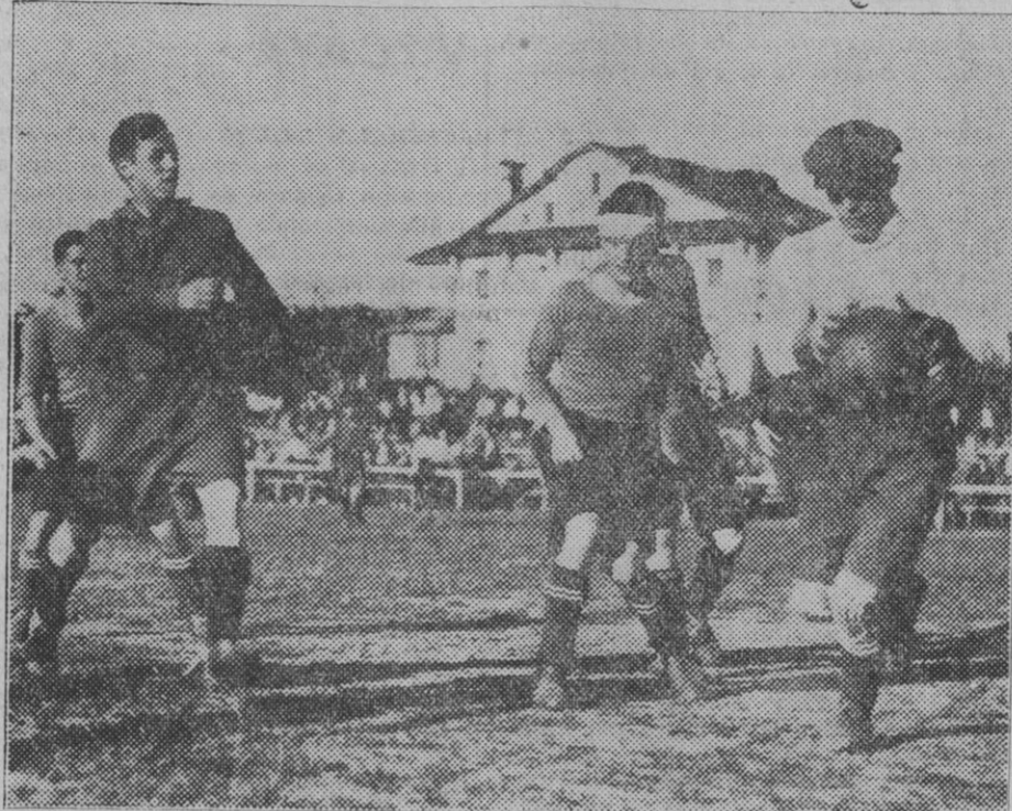
Un momento del partido de inauguración de la temporada jugado anteayer entre Osasuna y Aurrera, de Vergara.