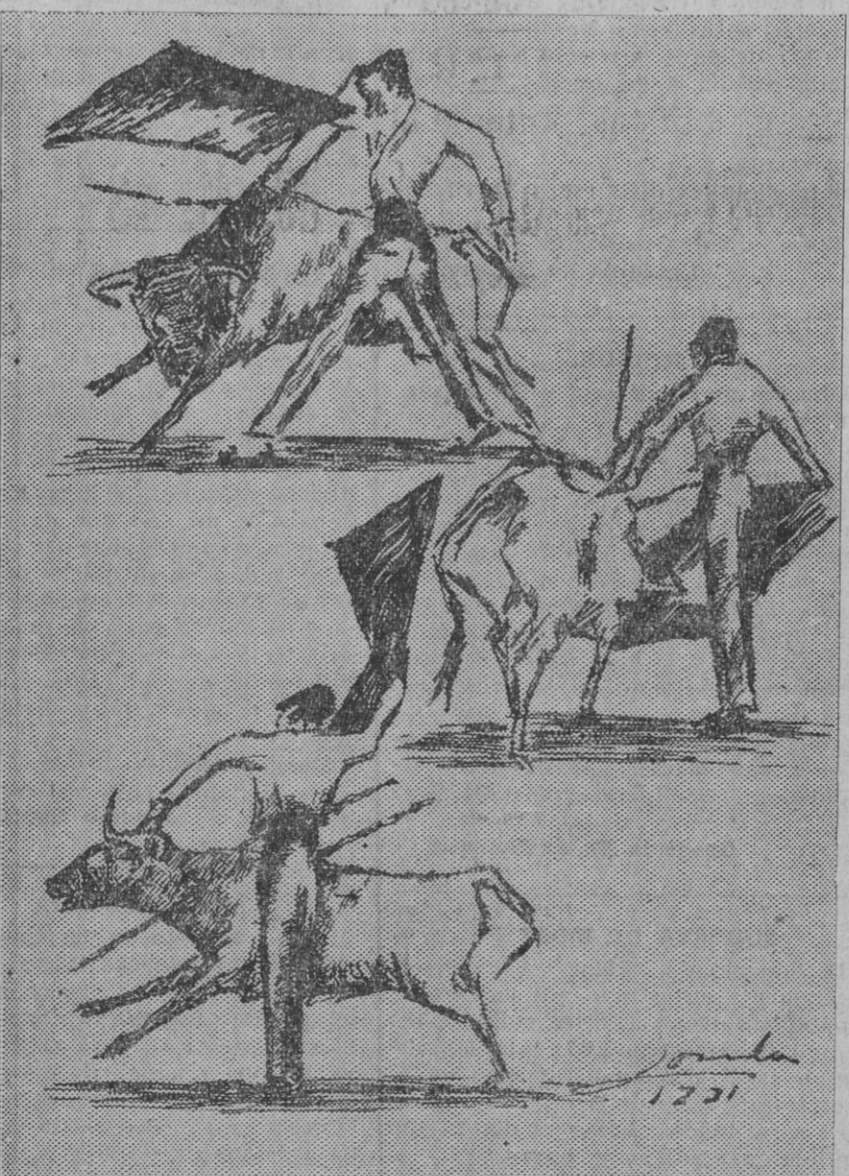
Cirujeda, Obón y Flores, durante las faenas de muleta que realizaron con las novillas que les correspondieron en suerte (Apunte de Lorda).