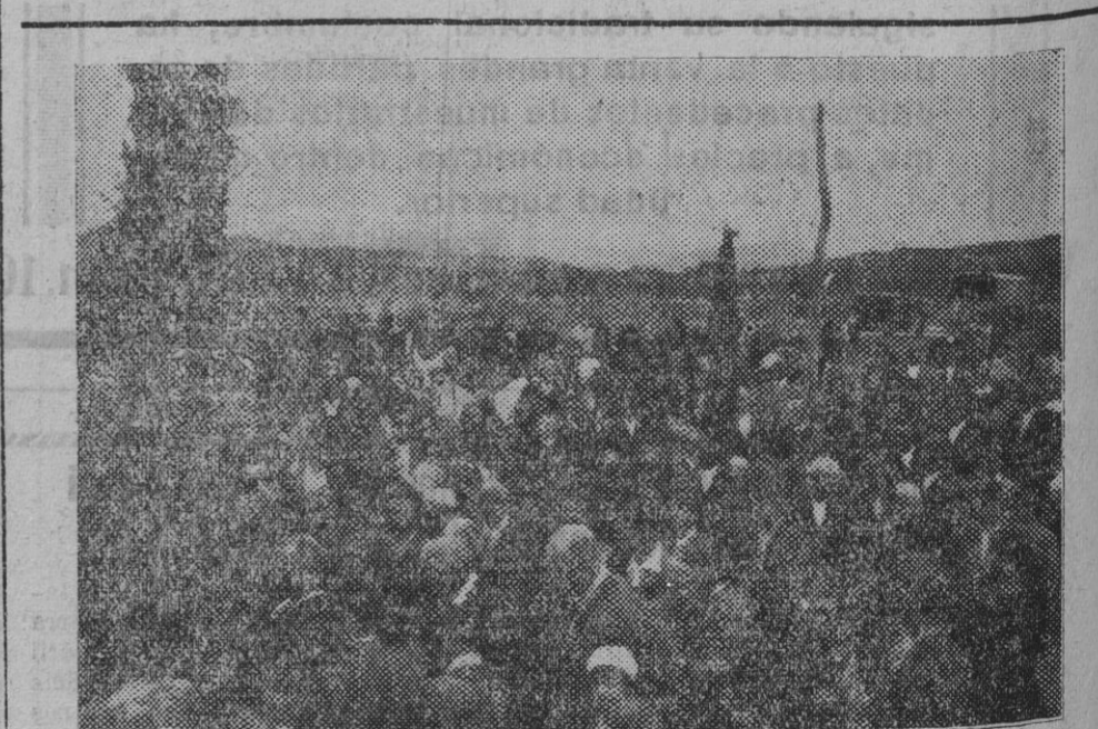
DE VILLATUERTA.—Los fieles que acompañaron y recibieron los venerandos restos de San Veremundo, desde Arellano a Villatuerta.

Garage Rada y Moreno Servicio permanente Amaya, 9 - Tel. 1718