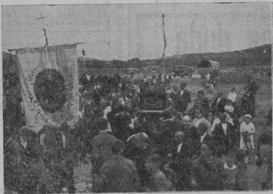
DE VILLATUERTA.—Llegada de los sagrados restos de San Veremundo.

escasa que apenas se ha recogido para sembrar. El año pasado entraron en el granero de la Caja 17.000 robos de trigo y quedó mucho en los gran- eros particulares; y este año han entrado solamente 3.000 y no quedan en muchas casas ni para las galli- nas.