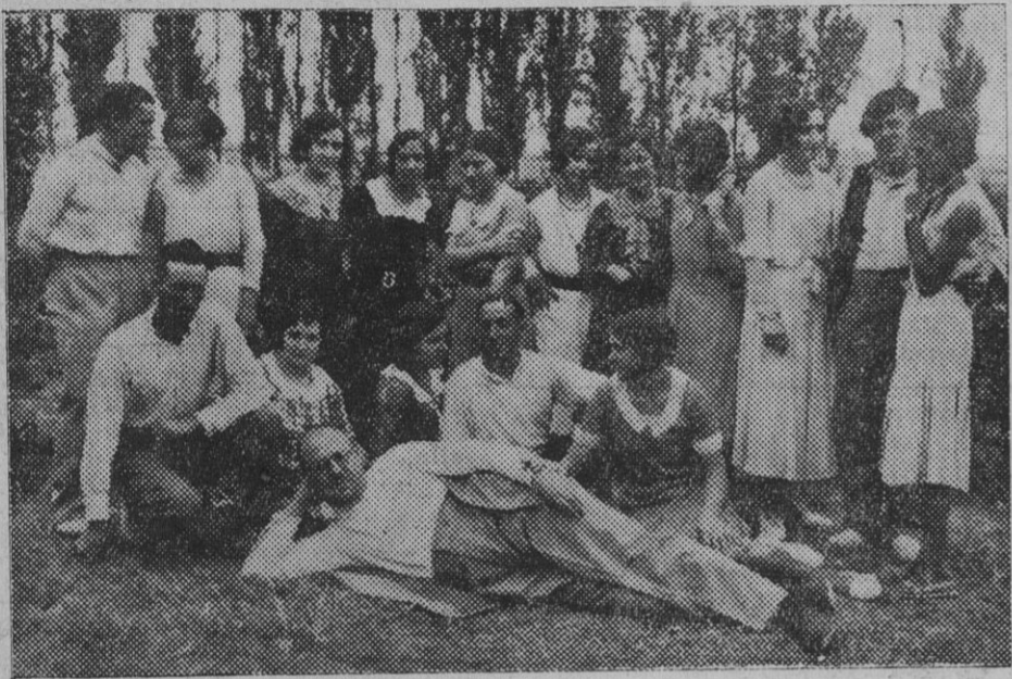
DE PITILLAS.—Esperando la hora del baile, que es la nota animadora de las fiestas patronales.

El del ganado, bueno. En los campos hace falta mucha humedad. Tiempo probable, bueno. Viento reinante, Norte.