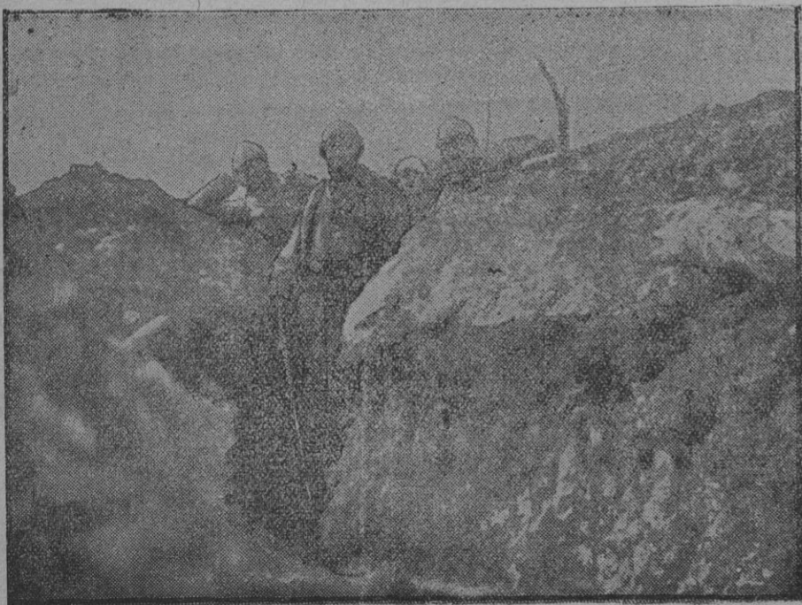
De la guerra.—Visitando el frente de batalla