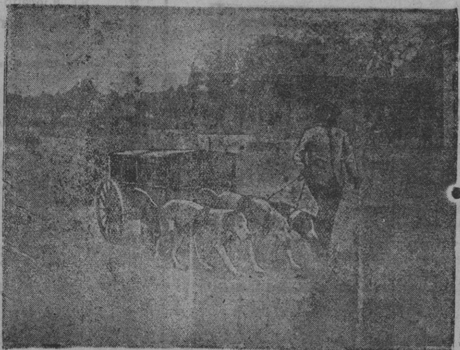
De la guerra.—Carro de víveres, conducido por perros

Es evidente que en él se tratan las cuestiones que están a la orden del día en los círculos eclesiásticos y diplomáticos, tales como los medios