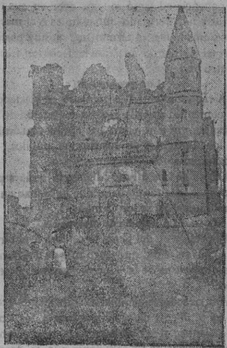
De la guerra.—Una villa de Francia, después de un ataque aéreo