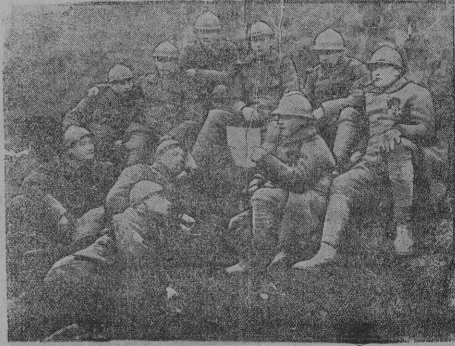
De la guerra.—Soldados leyendo, en los ratos de ocio