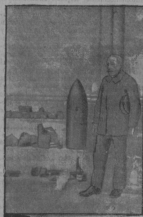
Onús sin explotar.

Para que las bajas de utensilio y material farmacéutico de los hospitales militares sean debidamente intervenidas, las Juntas facultativas formularán las correspondientes relaciones, de las que se sacarán copias certificadas, que se presentarán al comisario interventor del Establecimiento, para los efectos oportunos. Una vez verificada la intervención, las Juntas de referencia formularán las actas de baja y reposición que correspondan, dándoles el curso reglamentario y acompañándolas de una copia certificada de las relaciones intervenidas.