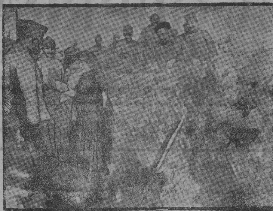
DE LA GUERRA.—Ingenieros franceses inspeccionando el sector de Souville.

Hasta la terminación del año escolar siguiente a aquel en que acaben las hostilidades, los pupilos de la nación disfrutarán del régimen que les corresponde por el decreto de 8 de Diciembre de