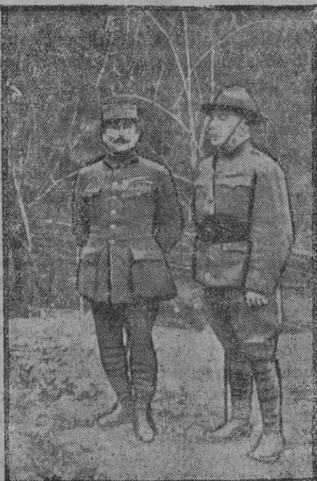
Generales franceses y americanos.