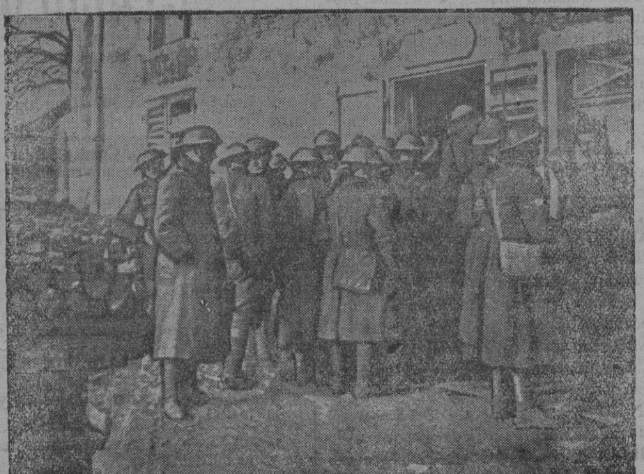
DE LA GUERRA.—Soldados americanos aprovisionándose antes de marchar a la línea de fuego

A pesar del mal tiempo, la jornada se ha señalado por acciones de artillería bastante serias en el frente Dolant-Varlar, al Norte de Ejumnica y en la curva del Czerna.