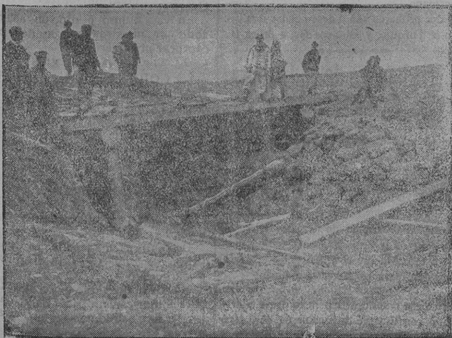
D. L. GUERRA. O.rra. de fortificación en Tioselle.