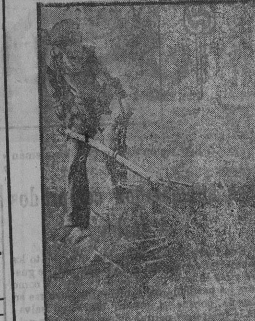
Mutilados de los dos brazos trabajando en la recolección.

Jamás la escuadra inglesa cumplió un deber más grande. Como prueba de la labor realizada por la Marina de guerra inglesa, basta decir que transportamos 13 millones de hom