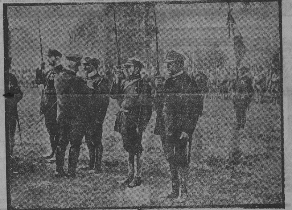
El almirante Ronarch visita á los fusileros franceses.

No hay noticias de interés de ningún frente. Los partes alemanes repiten el recuento del botín cobrado á los italianos, y éstos manifiestan que se están rehaciendo sobre la línea del Tagliamento, sostenidos por la vigorosa resistencia de su heroico tercer ejército.