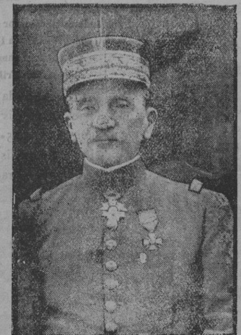
El general Marel.

No son necesarios hoy esos miles de caballos; con pocos puede atenderse á la necesidad, según vemos hoy en el articulado del Real decreto que citamos, corroborando legislativamente lo que los informes oficiales dicen.