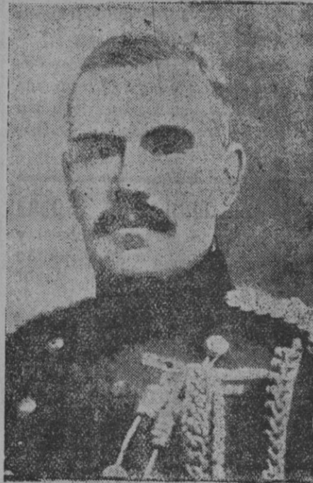
El general Robertson.

VIENA 24.—En la región de Skumve desalojamos a los franceses de una posición. En una operación felizmente llevada a cabo un destacamento austríaco logró