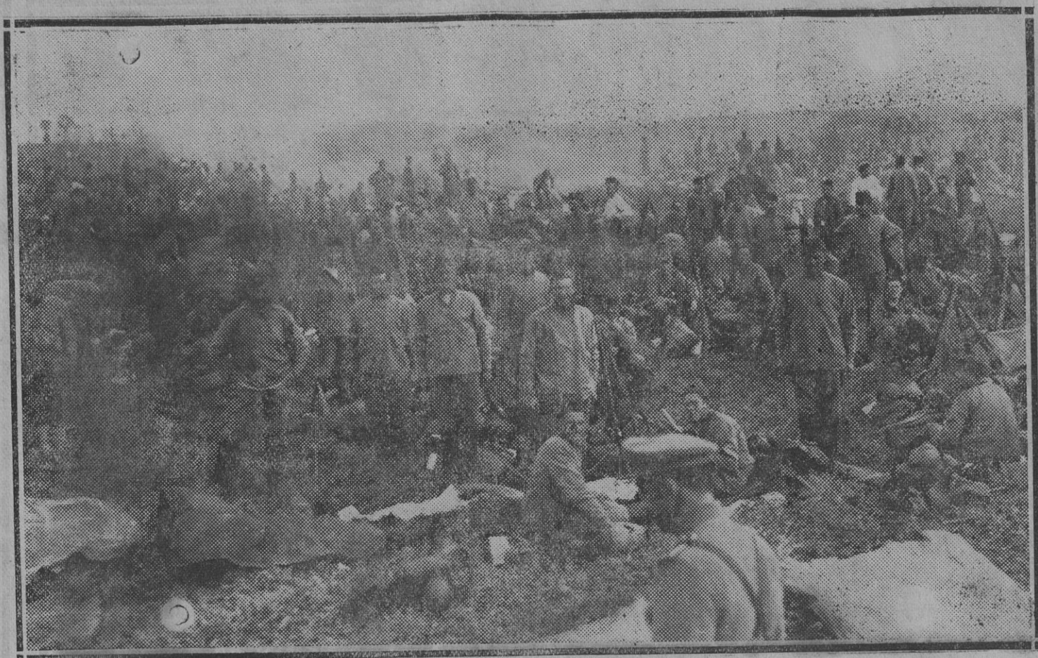
En el frente francés.—Un regimiento vivaqueando.

GRASES, Clavel, 10, Fuencarral, 8 y Atocha, 18