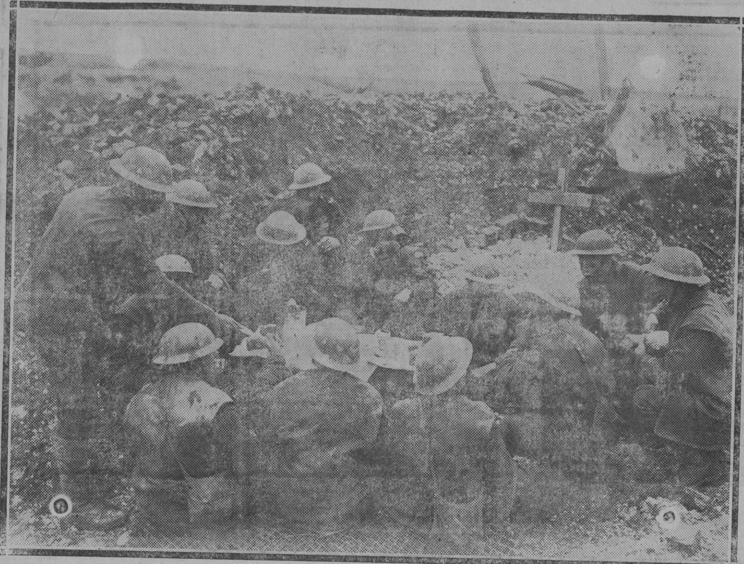
La hora del rancho de la tarde, en la trinchera del frente de Verdun.

NUEVA YORK 9.—Ha fallecido Monsieur Wilkins Guthrie, embajador de los Estados Unidos en Tokio.