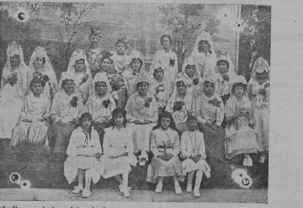
Señoritas que sirvieron la merienda á los niños de las escuelas públicas de la ciudad de Tetuán, fueron obsequiadas con motivo de las fiestas de los Cuatro Caminos.

Obedece este aplazamiento al deseo expresado por determinadas entidades, interesadas en el asunto, de disponer de un lapso de tiempo extenso que les facilite su examen detenido. Por indicación del alto comisario, y á propuesta suya, se han acogido favorablemente estos deseos, teniendo en cuenta que en este caso es la Administración la primera interesada en dar á la iniciativa particular cuantos medios puedan conducir á favorecer y activar la competencia, y á promover la presentación de ofertas ventajosas y meditadas.