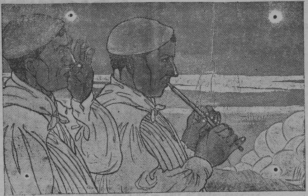
Una acuarela notable de la Exposición artística de Cabanas-Oleza,

El vecindario de Villanueva del Duque se muestra indignadísimo contra los malversadores, y aplaude la actitud del juez de Pozoblanco, que trabaja activamente.—El corresponsal.