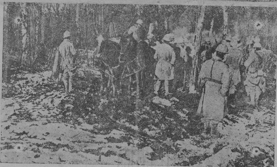
Tropas francesas de reserva acampadas en un bosque cercano a Verdun.

«Nuestras relaciones son cordiales con el Reino Unido—agregó—, como con los demás países, así beligerantes como neutrales, y se infiere una ofensa al prestigio nacional suponiendo que