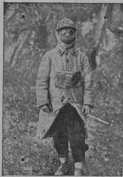
Nuevo uniforme de soldado francés.

También dice que la artillería francesa era escasísima, y que por serlo causaron los alemanes grandes estragos en los defensores de la plaza.