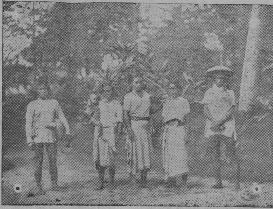
Indígenas cristianos del pueblo de Abra, en la isla de Luzón, que ha sido arrasada por un ciclón, según noticias telegráficas.

Ahora, el objetivo inmediato de los alemanes en Servia parece ser Kragujevatz, arsenal único del país. La distancia que los separa es sólo de 15 kilómetros. El avance hasta ahora viene siendo de