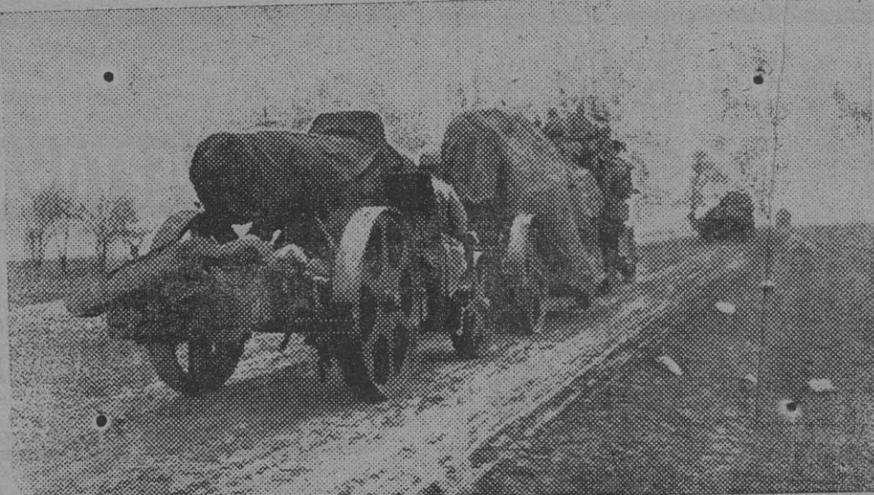
Mortero austriaco en las carreteras de Polonia.

Como el creciente desarrollo de los productos americanos necesitan el mercado europeo, a la vez que de Europa habrán de menester siempre importar otros, cada día el tráfico se ha de intensificar y a ambos mundos conviene vivir