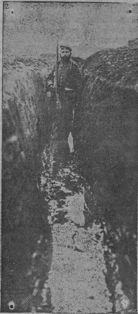
Trinchera de comunicaciones de tres kilómetros de longitud.

Creemos que no será preciso pedir para esos guardias la recompensa a que son acreedores y que debe concedérseles inmediatamente. Seguramente, el director general al enterarse del acto heroico realizado por sus subordinados, habrá tomado la iniciativa de la recompensa que pedimos se haga pública para estímulo y mayor significación.