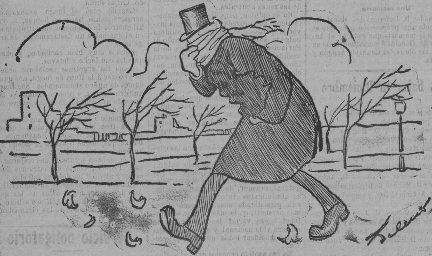
¡Uf, que malos vientos! ¡Me parece que voy á salir por el aire!