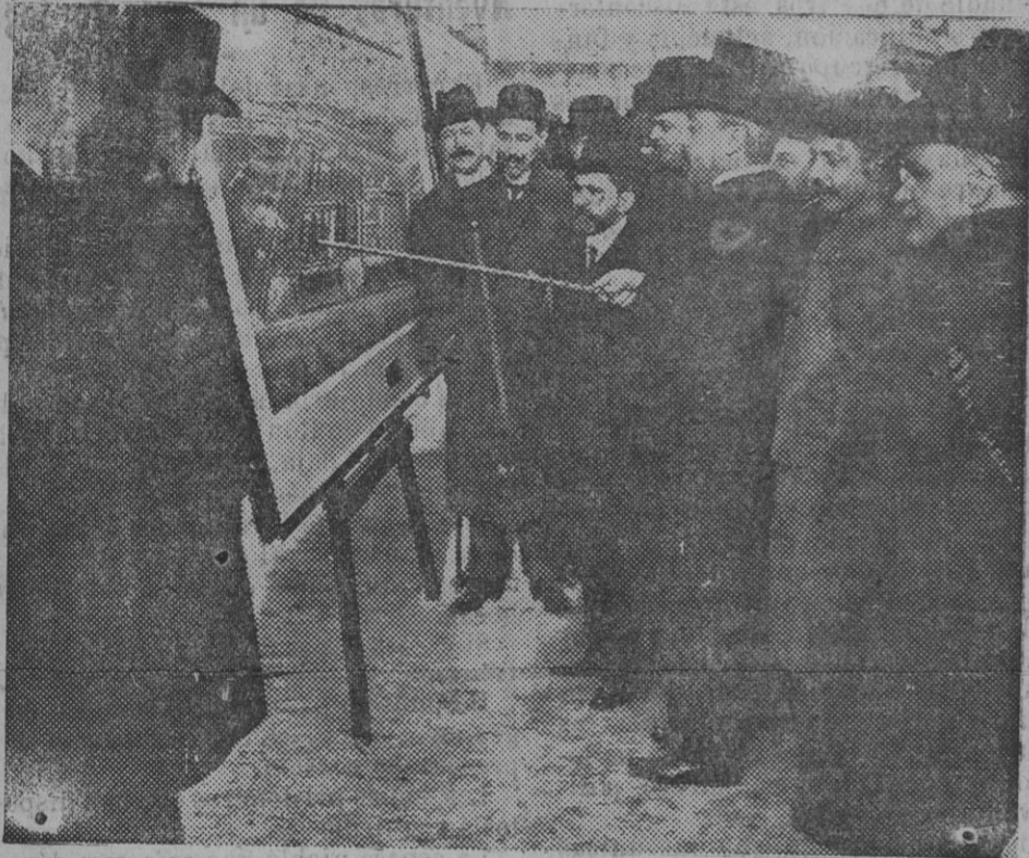
El alcalde explicando las condiciones del nuevo Matadero sobre un plano del mismo.

La riqueza de esta isla tiene su principal manifestación en el comercio marítimo y señal de éste es el número de buques que fondean en sus puertos, trayendo toneladas de mercancías ó que zarpan llevando á otras latitudes el fruto del trabajo agrícola é industrial de los nobles hijos de esta provincia española.