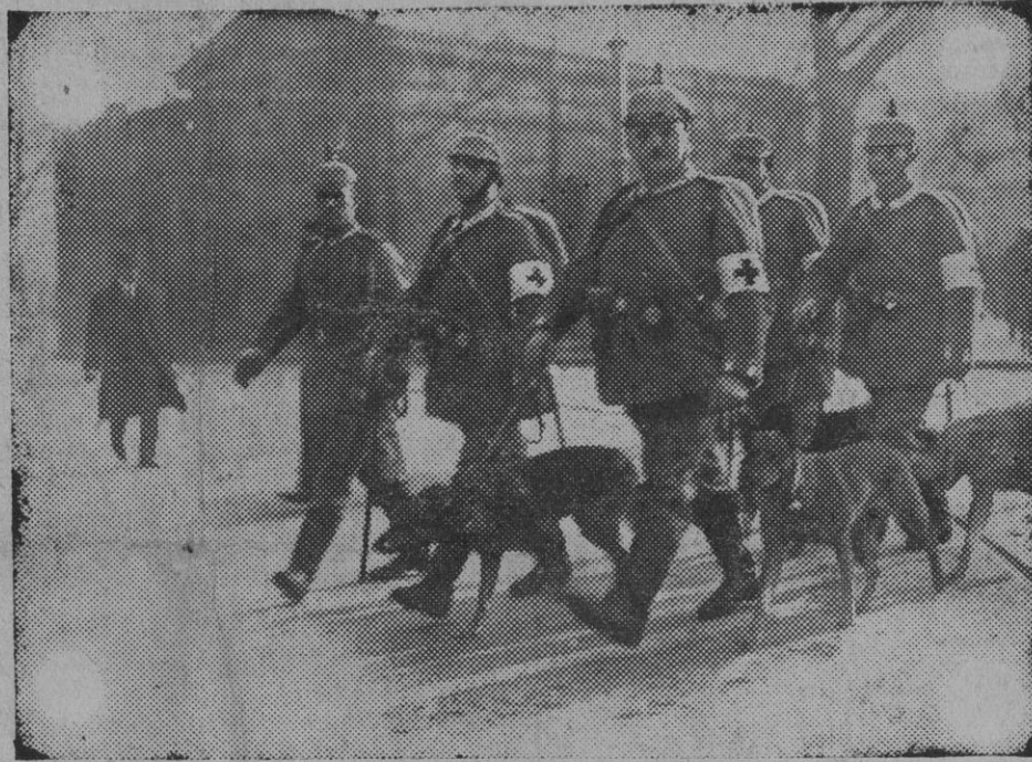
Perros de una brigada sanitaria alemana destinados á la busca de los heridos en la línea de fuego

convocados por el Sr. Dato los jefes de las minorías del Congreso.