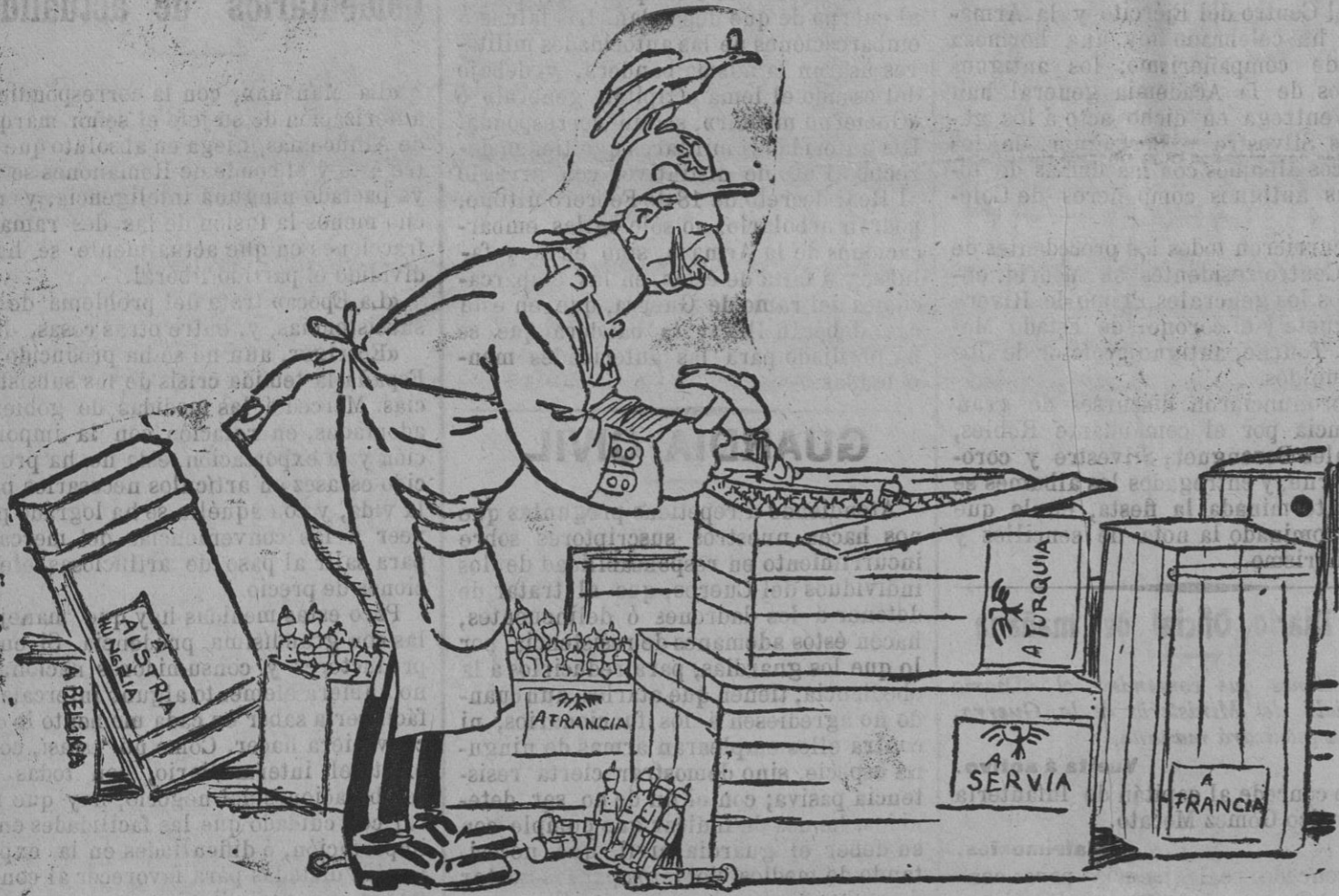
(De «Horacio Madrid».)