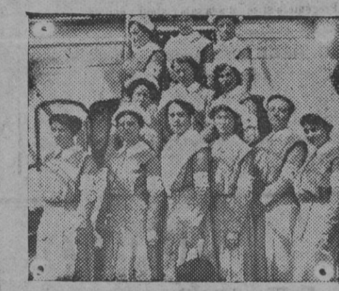
La Cruz Roja norteamericana.—La Delegación de Filadelfia.

Desde hace algunos días en los países extranjeros se vienen publicando noticias sobre pretendidas grandes victorias rusas en Polonia, contra lo cual conviene hacer constar que los combates cerca de Lodz continúan aún de manera indecisa.