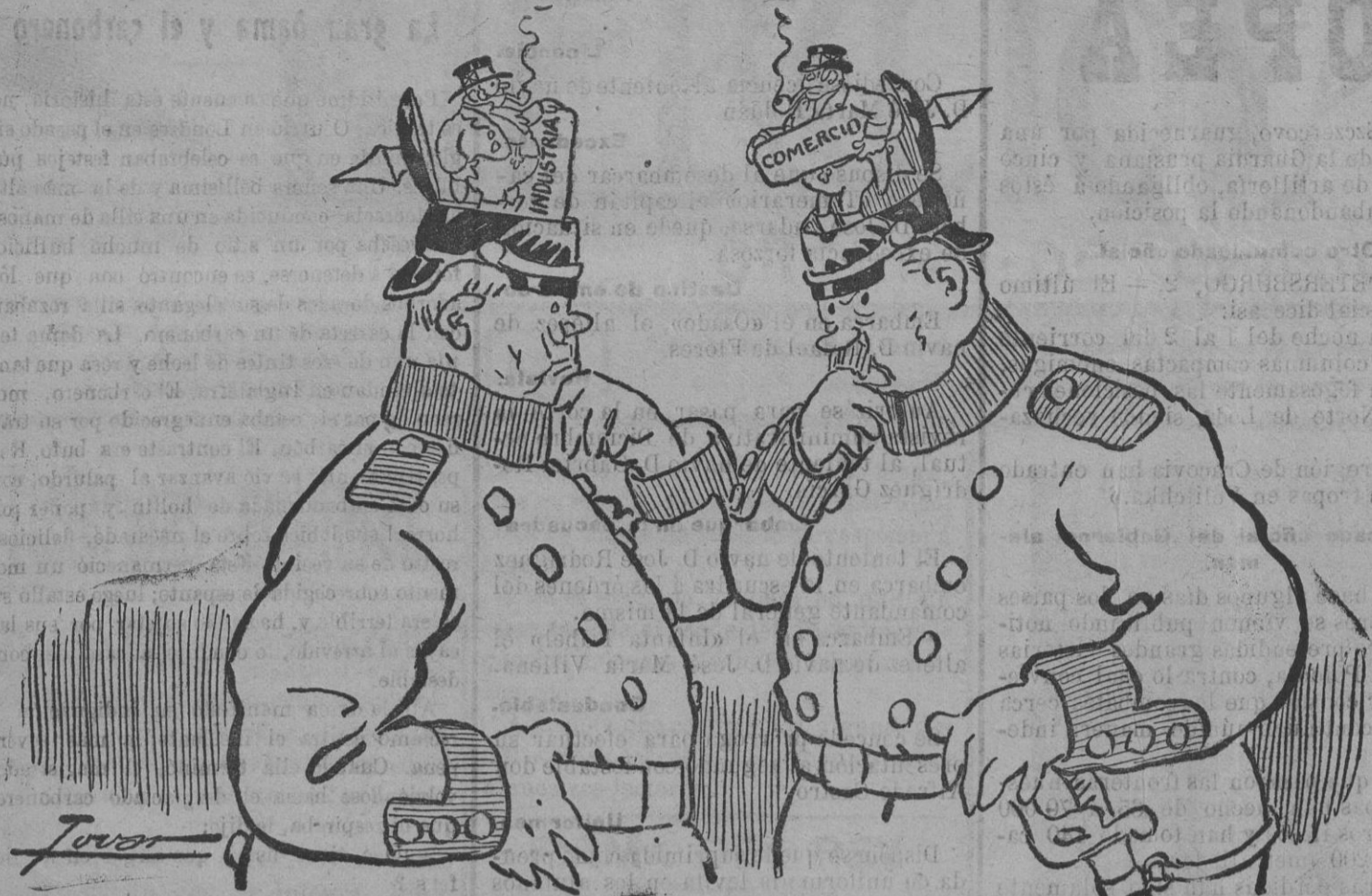
Y que nos están calentando los cascos!