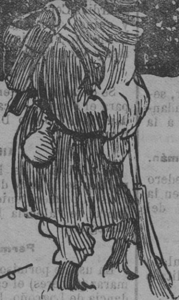
Unos y otros copades!