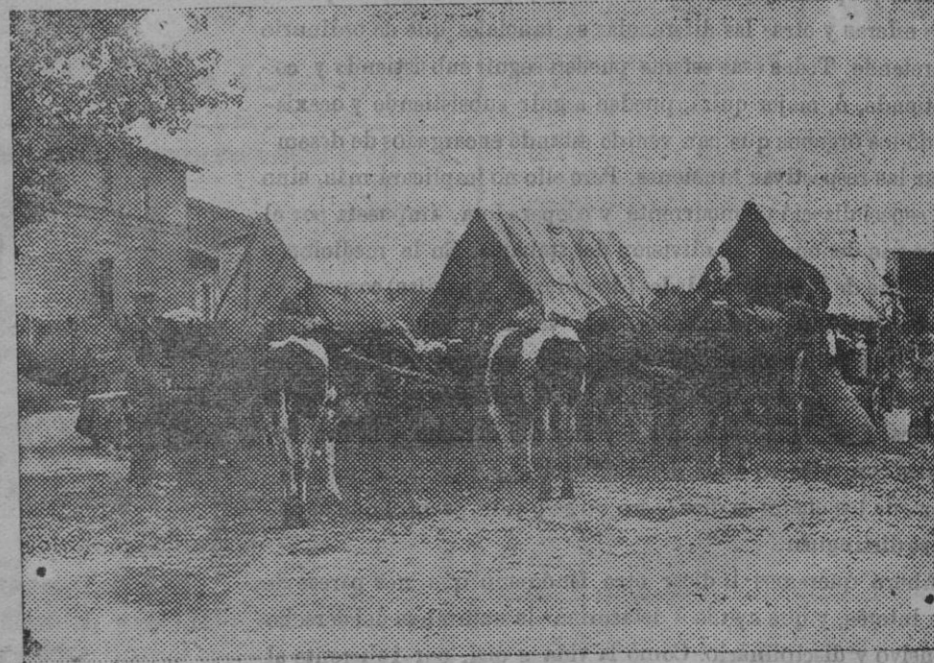
Domicilios improvisados de familias prusianas.

Confirmó el Sr. Dato que el Presidente de la República francesa, acompañado del jefe del Gobierno y de los presidentes de las Cámaras, irá á visitar las fuerzas de la frontera del Este.