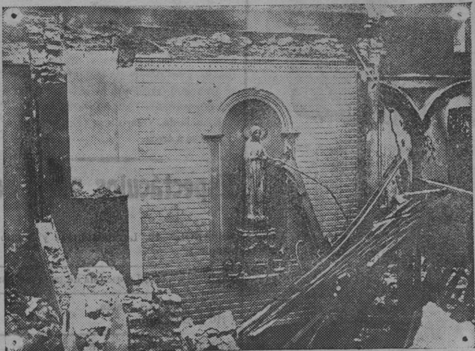
Interior de la iglesia de Fiermont, destruida por un obús alemán. Sólo quedó intacta la imagen de la Virgen.

Días 7 y 8.—Altas. Extranjero. Super- vivencias. Todas las nóminas. Día 9.—Retenciones.