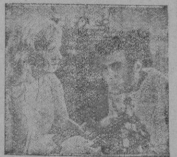
Una escena de la película.

No miente ese "slogan" publicitario que señala a "El Farol Azul" como una película filmada en homenaje a Scotland Yard. Porque eso es en realidad desde su comienzo—ya originalísimo y audaz—hasta el mismo final. Se nos muestra la exacta maquinaria de la vieja casaca de la mundialmente famosa policía, en sus detalles más diminutos y también en su aspecto cordial, familiar. A Scotland Yard va a parar la mujeruca que perdió su cartilla de racionamiento, la histérica que busca desconsolada a su perro, y el peligroso criminal que costó horrores detener. En Scotland Yard, el veterano policía a punto de jubilarse, el novato recién salido de la academia, el inspector saaz y comprensivo, el comisario que se afana por dejar el vicio del tabaco... Todas esas cosas diminutas, dan aliento, vida