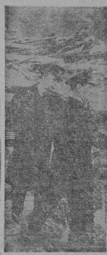
Copenhague. — Su Majestad el Rey Federico de Dinamarca, inspecciona personalmente los daños causados por la explosión de ocho minas de media tonelada cada una en el depósito de municiones de la Armada danesa.

El Cairo 29. — El Gobierno ha anunciado su decisión de asumir el control de los llamados "batallones de liberación", que se constituyeron para la "defensa del solar patrio" poco después de que comenzaran los choques entre egipcios e ingleses. Los dirigentes de los organismos que constituyeron dichos batallones se han mostrado conformes con el plan del Gobierno. El comunicado oficial facilitado al respecto, dice que el Gobierno se encargará de la instrucción militar de los batallones, prohibiéndose que organismos particulares recauden fondos para financiar batallón alguno. Se añade que esta medida se ha hecho necesaria, a causa de la infiltración de elementos criminales entre los patriotas honrados, que llevan a cabo ofensas contra las personas y los bienes materiales, amparándose en el prestigio de los batallones. — Efe.