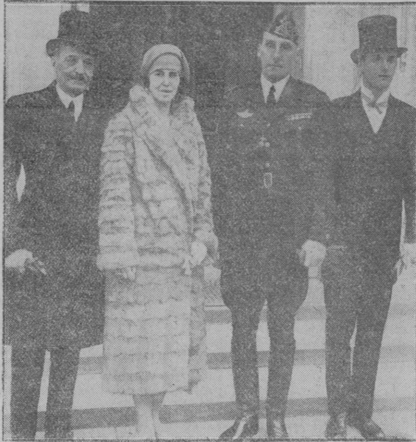
NUEVA YORK.—Los Infantes españoles don Alfonso y doña Beatriz con don Alvaro de Orleans y el Embajador de España en los Estados Unidos, en el momento de salir de la Casa Blanca, de visitar a mister Coolidge, Presidente de la República.