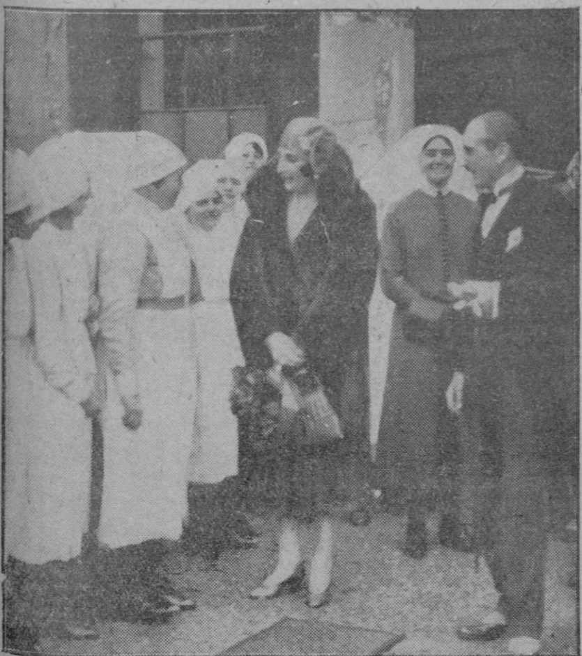
LONDRES.—Su Majestad la Reina doña Victoria durante la inesperada visita que hizo al Hospital Fever, uno de los mejores de Inglaterra, hablando con las enfermeras.

Cada descubrimiento importante de nuevas fuentes de energía ha significado una etapa en el progreso material de la Humanidad, y el hombre, reduciendo su esfuerzo físico, se ha procurado estados superiores de bienestar. Todos los europeos remando