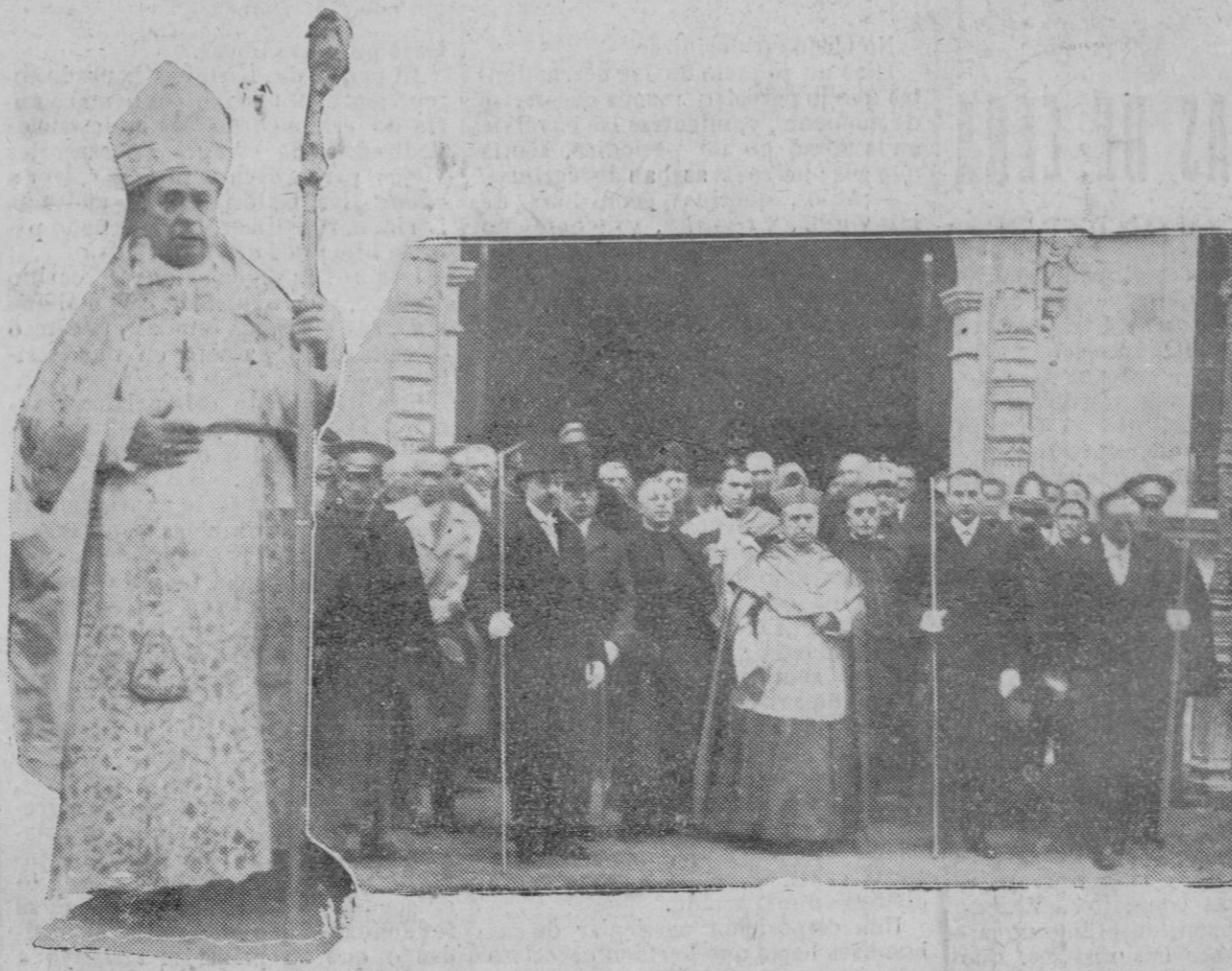
BURGOS.—El nuevo Arzobispo de Burgos, Doctor Castro, revestido de Pontifical, que acaba de tomar posesión de su cargo.—El Doctor Castro, con las Autoridades, a la salida del Arzobispado.