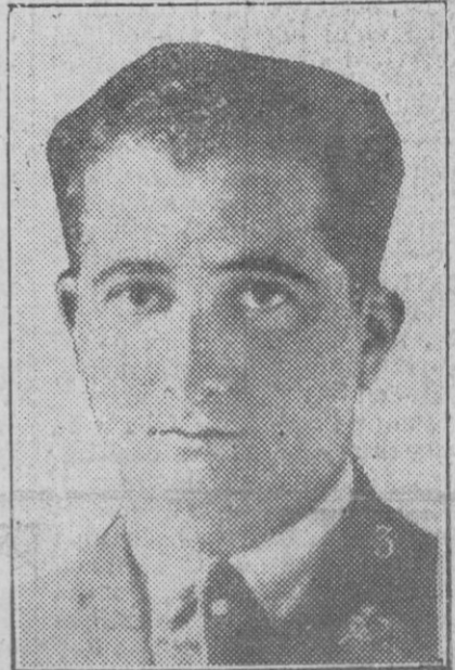
El Comandante Ramón Franco, que mandando el hidro «Numancia» ha llegado hoy a Palma.