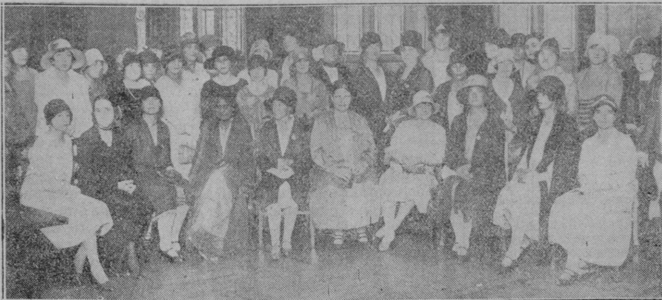
MADRID.—Grupo de concurrentes al Lyceum Femenino, donde se ha dado un té en honor de las Delegadas del Congreso de Mujeres Universitarias que se está celebrando en la Corte.

En vista de ello el juez ordenó que Oscar fuera sacado de la cárcel y lle-