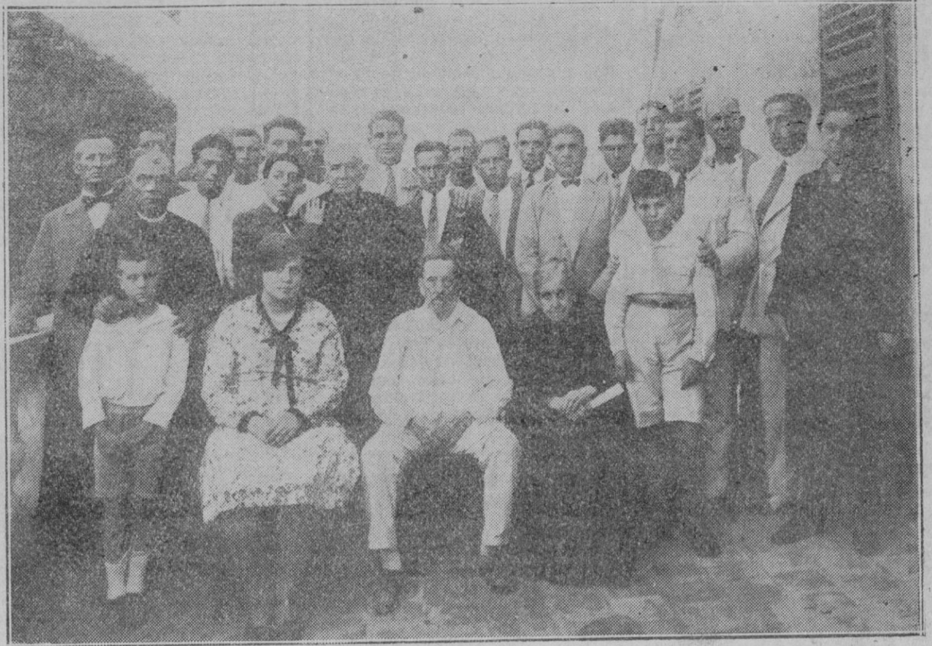
El ilustre mallorquín General Weyler, en su finca «Son Roca», con su hermana doña Celestina, su hijo el Marqués de Tenerife, otros familiares y una comisión de vecinos de las barriadas de Ca'n Lluís y So'n Ferriol, que el pasado lunes la visitaron con motivo de cumplir el Duque de Rubí el 90 aniversario de su nacimiento.

Los derechos de importación de las sardinas envasadas en aceite han sido reducidos en un 10 por 100 en Uruguay.