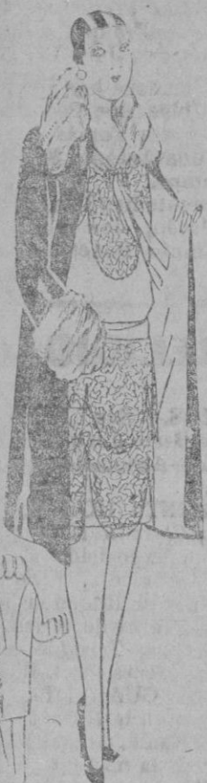
CONJUNTO.—Vestido y abrigo.— Este conjunto se compone de un abrigo recto en terciopelo marino forrado de gris y un vestido de encaje y crespón gris. Hebillas de esmalte en el escote. Cuello y puños de «petit gris».