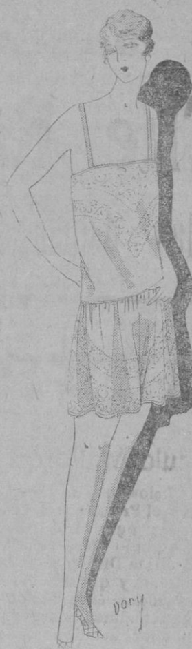
PANTALON-COMBINACION.— Bonito vestido de noche o de tarde que será acompañado muy elegantemente de la combinación pantalón-cubrecorse ejecutada en crespón azul pálido. Entredoses de encaje de Milan ocre que se incrustan en la faja.

para estar con un hombre que no le entretenga ni la divierta. El trabajo de una mujer en el hogar es monótono, y el marido debe por la noche distraerla con una conversación dulce y amorosa.