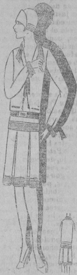
VESTIDO DOS-PIEZAS.— Dos piezas en jersey gris guarnecido de pliegues nervuras.

Las uvas purifican la sangre y actúan benéficamente sobre el pulmón, el hígado y el bajo vientre.