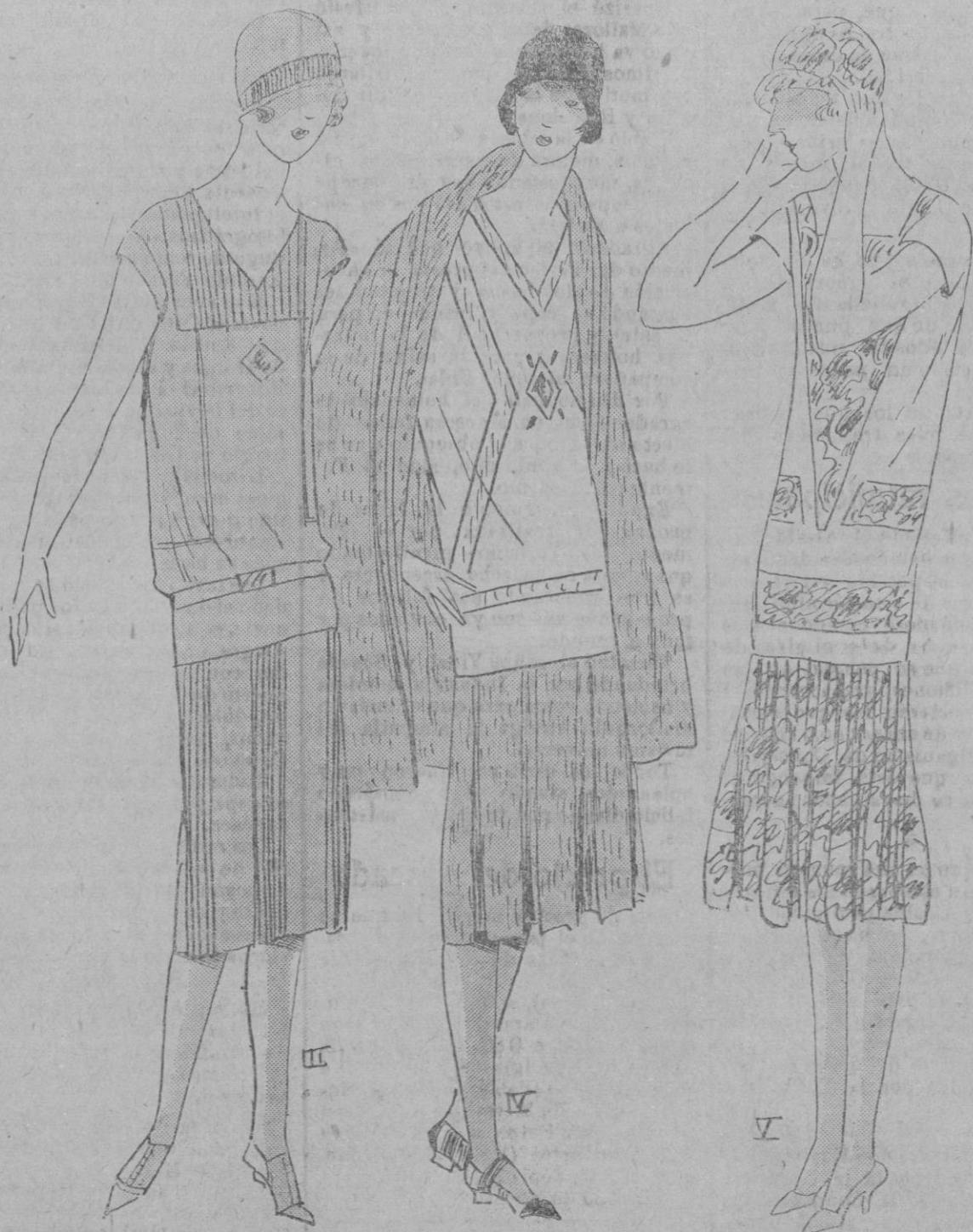
PANORAMA TOILETTES.— Encantador vestido de lienzo de seda limón; la falda plisada por grupo. El corpiño adornado de pliegues nervuras.—Tela: 3,50 en 1 metro.— Para los días más frescos se llevará en dos piezas de de kasha fantasy y de jersey liso para la blusa; la capa en forma de de kasha.—Tela: falda y capa 4,25 en 1,30. Corpiño jersey 0,80 en 1,40.—Vestido de cretona lisa y estampada.—Tela: Estampada, 2 m. en 0,80 metros.—Lisa, 1,50 en 0,80 metros.