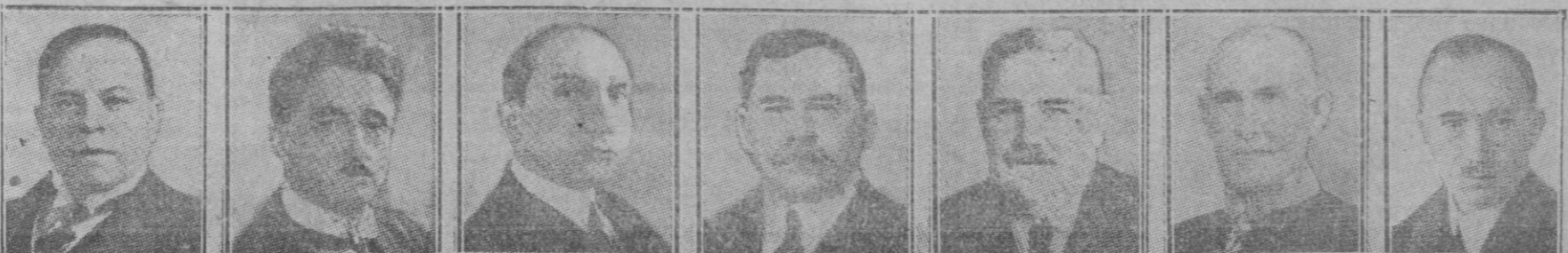
MACKENZIE KING Canadá MR. COSGRAVE Estado Libre Irlanda M. ZALESKI Polonia MR. SMIT Unión Sur Africa Senador M. LACHLAN Australia S. R. J. BARR Nueva Zelanda M. BENESH Checoslovaquia