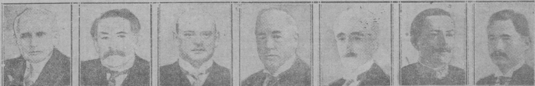
MR. KELLOGG Estados Unidos M. BRIAND Francia HERR STRESEMANN Alemania LORD CUSHENDUN Gran Bretaña M. HYMANS Bélgica CONDE MANZONI Italia CONDE UCHIDA Japón