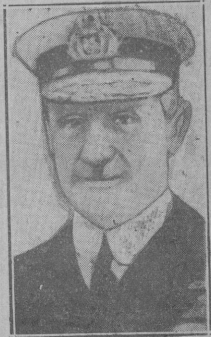
LONDRES.—El almirante inglés Jellicoe que con el Príncipe de Gales forma parte de la peregrinación británica a los campos de batalla de Bélgica y Francia.