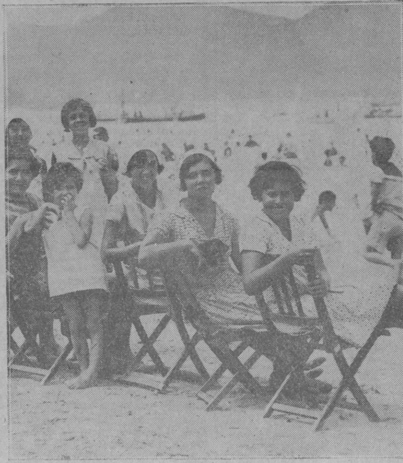
SAN SEBASTIAN.—Una escena de la playa en estos días de rabiosa canícula en que la temperatura alcanzó 52 grados al sol.

Lo reclama la comodidad del vecindario y lo exige, con imperativo inexcusable los altos intereses de la salud pública.