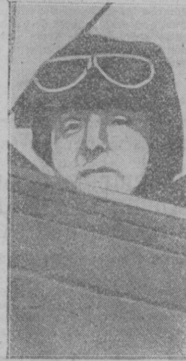
La intrépida aviadora británica, duquesa de Bedford, que en estos momentos se halla a bordo del aparato «Princesa Xenia» volando hacia la India Inglesa.