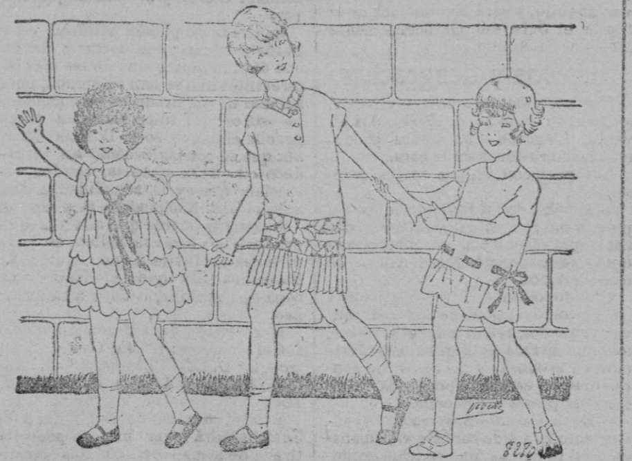
PANORAMA DE NIÑOS.—1 Vestido de tafetan azul pálido. Tres volantes superpuestos, recortados en dientes redondos. Cuello y bocanangas igualmente recortados.—2 Dos piezas para niña en shantung rosa vivo y shantung estampado.—3 Vestido de tussor rosa. Largo cuerpo al cual va montado un volante fruncido recortado en el bajo en dientes redondos. Una cinta rosa vivo ajusta un poco el vuelo.

Mallorca The Magnificent by Nina Larry Duryea A delightfully informal traveler's record of one of the loveliest spots on earth—Mallorca (sometimes known as Majorca), largest of the ancient and historic Balearic isles, midway between Sardinia and Spain in the Mediterranean. Greek and Roman, Goth and Moor, all the fierce savage sea-rovers have swept over Mallorca. Its beautiful art products are known among all nations. The courage of its men and the beauty of its women have been the source of legends and immortal songs. Herein is the history of Mallorca for eight hundred years, under the domination of Moor and Austrian and Spaniard. Here also is a picturesque story of its famous caves, its cathedrals and monasteries, its palaces and dream villas beside the sea, its people and its arts and its customs. Mrs. Duryea's book offers pleasurable entertainment to the stay-at-home, and full preparatory information for the traveler, 8vo, about 250 pages, illustrated. Precio 15 pesetas. De venta en la Librería de José Tous. MUCHACHO DE 16 AÑOS Se desea para bodega, buenas referencias. Avenida de Antonio Maura, n.º 42.