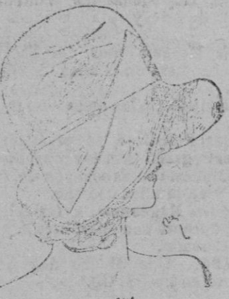
SOMBRERO.—Georgette utiliza una paja nueva, el Mikio; y concibe esta forma conduciendo en parte trabajada de puntos crepón georgette y guardacapa de pétalos en una armonía malva muy púdica, suave al rostro.

los que se emplea de preferencia, el parasol, el bailluk y el cellophane; las dos primeras son pajas de gran sobriedad y la última, de gran brillantez y muy gruesa, lo cual no le impide triunfar porque la moda parece inclinarse a la paja gruesa. También la toca de flores, ha logrado colocarse en el sitio de honor.