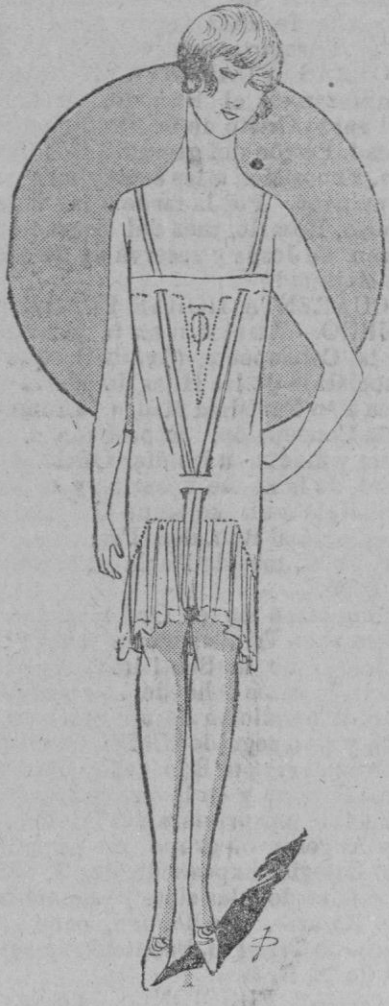
ADORNOS.—He aquí un adorno muy bonito y además de un encantador aspecto de novedad; tan es verdad, que no se sabe que inventar para agrados, coquetería femenina. En contrapunto aquí, pues, una falda-pantalón de lienzo de seda paja.

Nuestros colaboradores CRONICA DE LA MODA