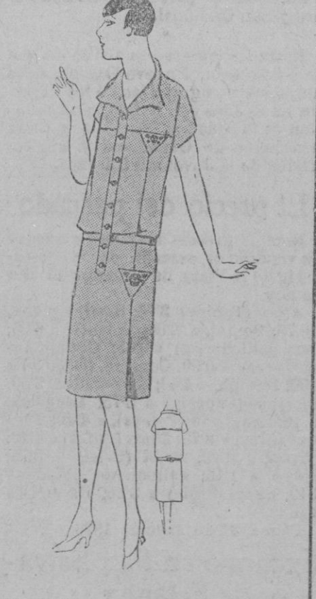
VESTIDO.—Dos piezas cuya falda es de fina lana montado en empiecimiento y busa de crepón de china con nervuras a través. Banda ajustada en una hebilla a la cintura.

baño. En efecto, la piel, nuestra única defensa externa, está expuesta a ataques constantes y, de un modo continuo, se están formando sobre su superficie, unos depósitos procedentes de las secreciones del cuerpo o del ambiente; partículas impalpables mas o menos nocivas, que flotan en el aire. La piel los detiene gracias a su impermeabilidad y defiende a la totalidad del organismo, contra los microbios. Naturalmente, si dejamos que este depósito se convierta en un gran stock, sufriremos primero una incomodidad, luego un picor, después una irritación y, por último, una enfermedad en la piel. Plévese en los innumerables enemigos que ya tienen las coquetas en los granos y otros accidentes producidos por una circulación defectuosa o por un órgano enfermo y se verá lo peligroso que es dejar la puerta abierta a otros agentes que pueden ser evitados y combatidos con un remedio tan sencillo, tan cómodo y tan práctico como es el de lavarse con frecuencia. El baño diario a 35°, que limpia el