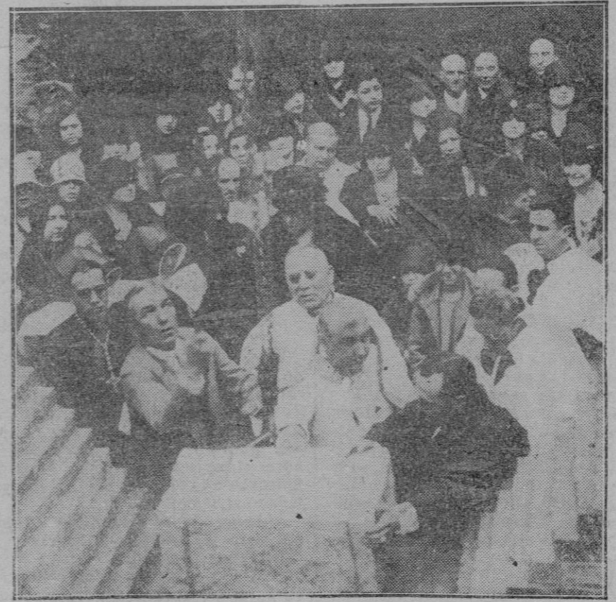
MADRID.—El viernes último, en el Colegio de Religiosas de San José de la Montaña, se celebró el acto de colocar la primera piedra del edificio destinado a ampliación del actual colegio.