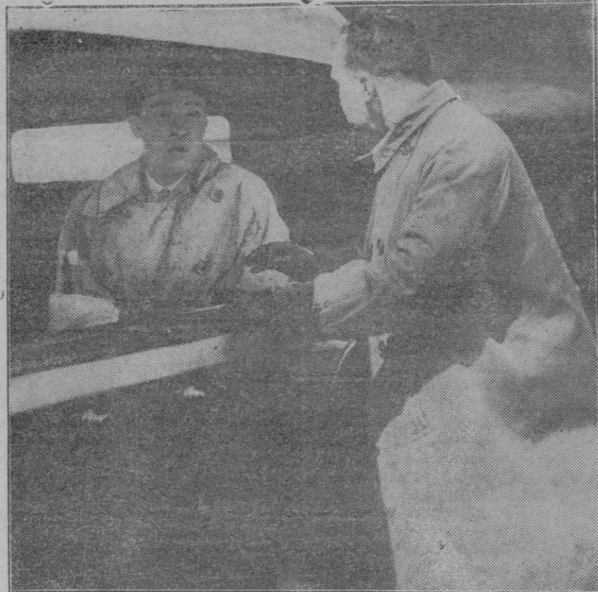
MADRID.—Su Alteza Real el Príncipe de Asturias hablando con el Presidente de la U. V. E. en el momento de entrar en la meta de la carrera ciclista celebrada el domingo.

Grato nos es que la constancia en la labor emprendida nos haya deparado de nuevo ocasión para aplaudir justamente la labor que la Asociación de Avicultores lleva a cabo en pro de una riqueza que por ser tantos los que de ella se benefician no podemos dejar de atribuirle, como antes decíamos, un carácter de riqueza, de interés general para Mallorca.