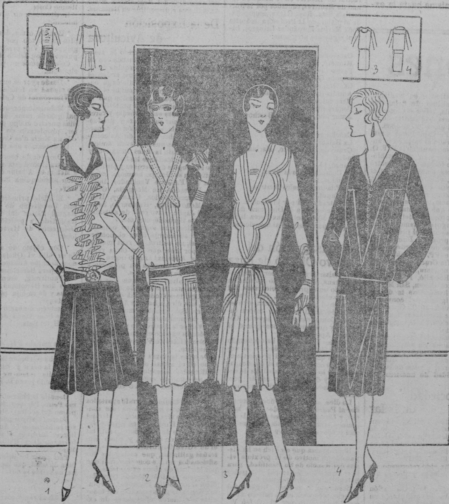
PANORAMA-TOILETTES.—1 Bébé de crespón china blanco y negro, estampado, montado sobre una falda de satén negro.—Tela: 2 metros de crespón china en 1 m. 3 m. satén negro en 1 m.—2 Vestido popelina gris claro, guarnecido nervuras finas.—Tela: 350 en 110.—3 Vestido de paño ligero azul paster, guarnecido de pequeños «soutaches» o grandes piques tono sobre tono.—Tela: 450 en 140.—Vestido terciopelo marrón. Tela 4 metros en 1 metro.