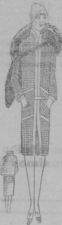
VESTIDO-ABRIGO.—Vestido-abrigo lana cuadrada bandes lana lisa bordeando cierre sostenido por una pata abotonada.

Insisto sobre el chaleco blanco de botones redondos de tela, la camisa plastron duro con botón en medio de tela, muy sencillo, y el cuello de puntas cortadas.