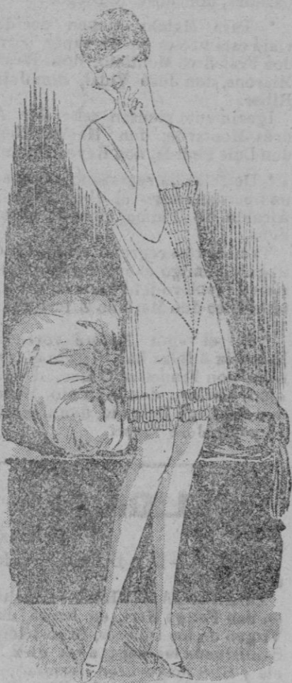
ADORNOS FEMENINOS. — En la figura vemos un conjunto de pantalón-cubrecorsé de aire de juventud y de bonito recogimiento. Yo creo que vosotras vais a querer todas poseer uno semejante. Lo hemos establecido aquí en crespón de China craso ibis, adornado con varios pequeños volantes de plisados finos, de grupos de pliegues sobre las caderas, y de claros con hilos tirados subrayando el bajo del corsé.