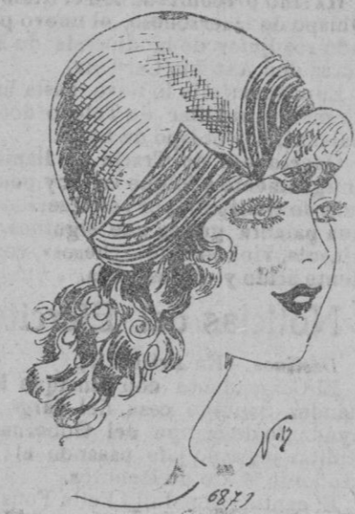
SOMBRERO.—Este sombrero es muy coqueto, es de picot escocés muy fino, guarnecido de tafetán y agasné azul marino.

Traje de noche.—El demi-tenu es el smoking azul obscuro con doble orilla. Para los bellos días será el pantalón gris perla liso sin baguette.