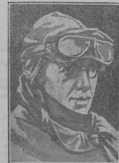
El piloto Hinchirlicefe que se teme haya desaparecido.