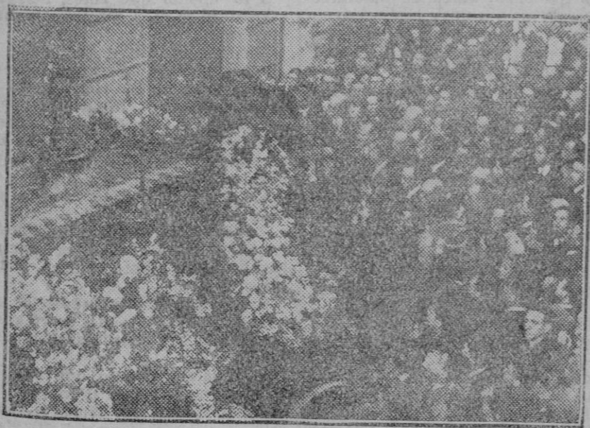
Féretro del desgraciado humorista Luis Estevo, cuyo entierro se verificó el jueves.—Momento de sacar el féretro de la casa mortuoria.