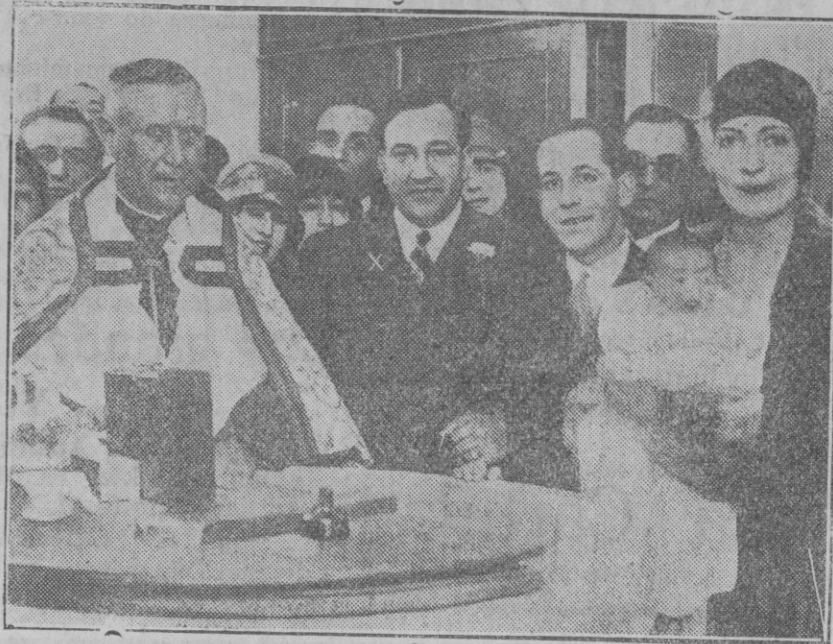
MADRID.—Momento de ser bautizada en la Iglesia Parroquial de Chamartin de la Rosa la hija primogénita del notable tenor Fleita.

Nogako, la princesa heredera del Japón, ha determinado el aprendizaje del idioma francés en Tokio con la condesa de la Salle.