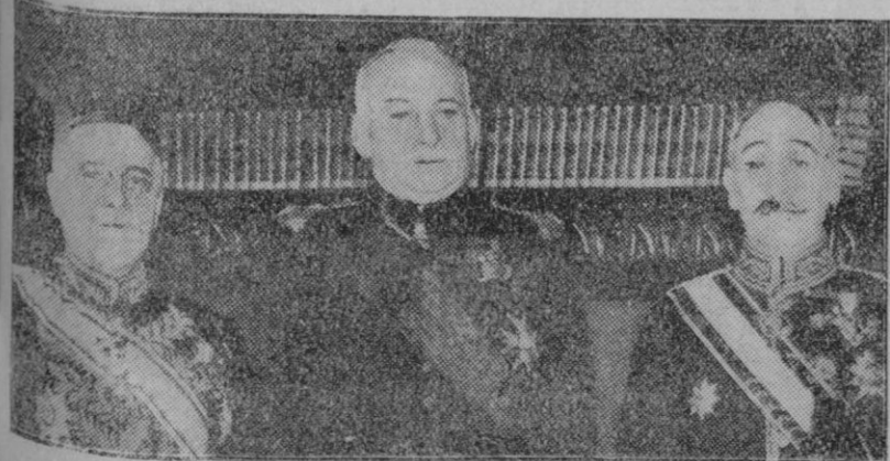
El Embajador de la Argentina a la izquierda, en su primera visita oficial al Presidente del Consejo de Ministros, después de la toma de posesión.

—Sí, señor; pero lo que no comprendo es cómo se aguantaban los hombres antes de descubrirse la gravedad.