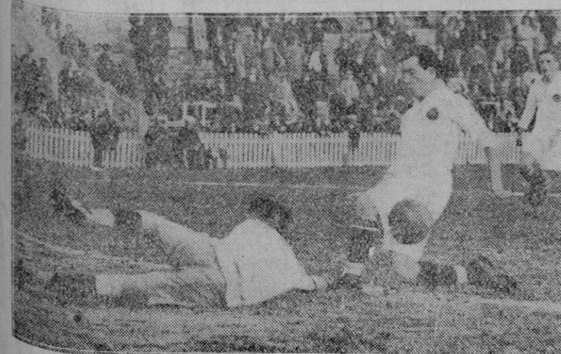
Un momento de apuro para el meta del «Athletic» madrileño.