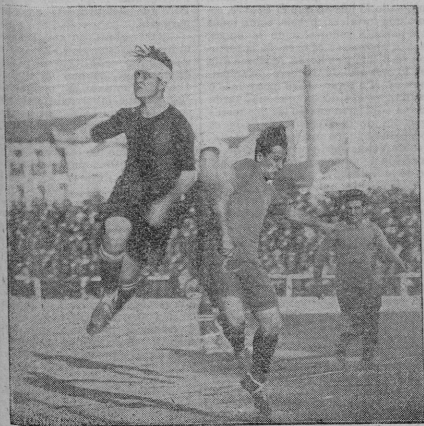
Un momento del partido jugado entre los equipos «Racing Club» y «Unión Sporting», en Madrid.

El cultivo del trigo, según todas las deducciones, fué importado de Oriente. Se le encuentra en Egipto, nada menos que cuatro mil años antes de la Era Cristiana; pero se desconoce la época de su introducción en Egipto,