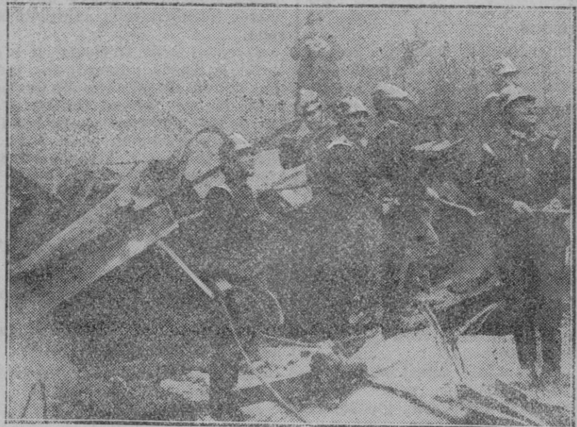
MADRID.—Detalle y aspecto en que quedó el Teatro Barbieri, después de su incendio.

El lago más profundo que se conoce es el Baikal, en Asia, que tiene más de dos mil metros de profundidad.