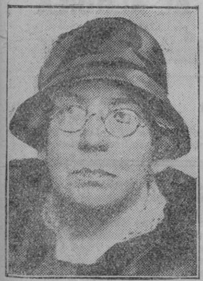
La ilustre escritora Gracia Deledda, de nacionalidad italiana, ha quien se ha concedido este año el premio Nobel de Literatura.

Londres.—Según el doctor Milder, hace actualmente más frío en el Mediterráneo que en Groenlandia.