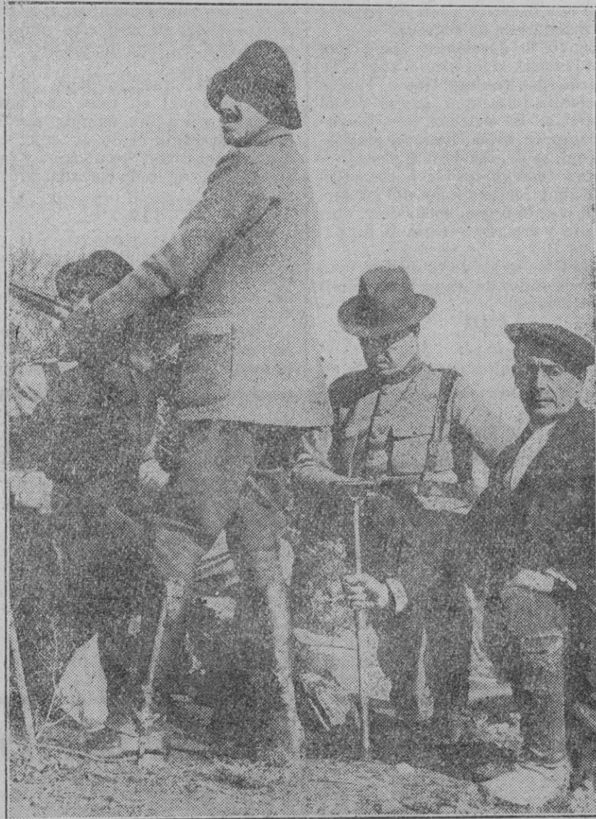
MADRID.—S. M. el Rey en la línea Los Hojuelos de Manzanares, dedicado a la caza, donde se han hecho interesantes tiradas de perdices y conejos.

El Consejo administrador de la Unión Panamericana ha aprobado el trazado propuesto, y como aquel Consejo se halla compuesto por los representantes diplomáticos de las naciones iberoamericanas, se deduce que los Gobiernos respectivos no ven, en principio, objeción alguna que oponer a lo que habrá de constituir una de las mayores empresas técnicas que el hombre ha acometido.