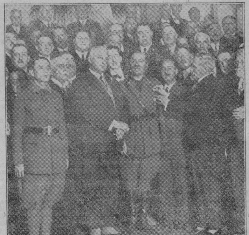
Momento de imponerle al general Millan Astray la Medalla de Sufrimientos por la Patria que los españoles de la Argentina le regalan.