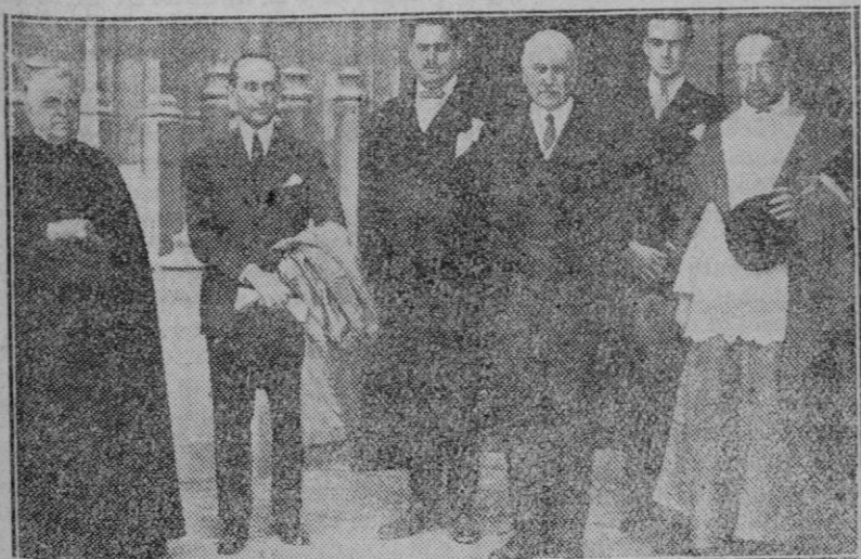
SEVILLA.—El Ministro de Relaciones Exteriores de la Argentina señor Gallardo, al salir de la Catedral después de haber depositado una corona de flores en el Monumento de Cristóbal Colón.