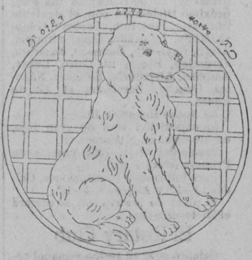
TRABAJOS DE LANA.—PODENCO JOVEN.—El dibujo representa sobre su asiento, las patas hacia adelante, la lengua fuera, como esperando que se le deje acercarse, a un joven podenco que se puede hacer en tinte fuego, con su punta de nariz «teta de negro» su lengua muy roja y sus ojos de un azul claro. La raja del fondo se hará en malva rosa.

Manufactura ropa blanca Equipos y Canastillas J. SANCHO CARRÍO «Villa Las Rosas» Artá.