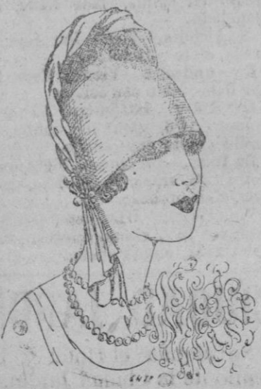
SOMBRERO.—El fieltro se presta para la confección de este modelo que viste muy bien y que adorna el bonito movimiento de una franja de terciopelo sostenido por una banda de joyería género antiguo. Tono del sombrero azul royal.

Una innovación que no debemos pasar por alto consiste en adornar las tocas con algunas plumas de avestruz encuadrando el rostro y co-