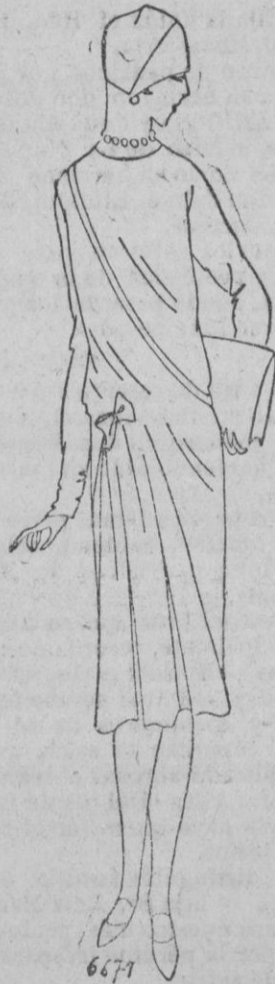
VESTIDO.—Vestido de tarde en crespon satiné, beige.

esencialmente femenino y que permite todas las interpretaciones de la materia dócil fieltro o terciopelo, de que está hecho.