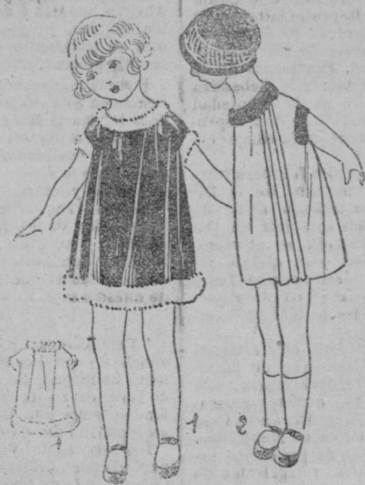
DEUX-ENFANTS.—1 Para bebé, pequeño vestido de terciopelo rojo, bordado de piel blanca con el alto fruncido.—Tela: 0'50 m. en 0'30 de anchura. 2 Vestido de crespon rosa, cuello y biases de las mangas en cintas de terciopelo azul marino.—Tela: 0'50 m. en 1 m.

Es V. cliente de la Sucursal número 1 de la CASA MATONS.