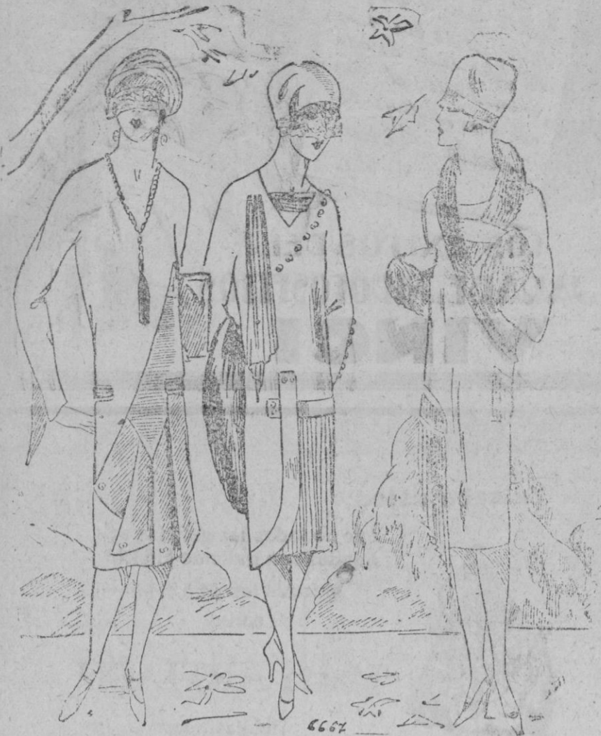
PANORAMA TOILETTES.—1 Toilete de terciopelo de lana y de otoman de un efecto muy nuevo.—2 Vestido de paño granate guarnecido de plisados de crespon de China.—3 Vestido-abriga de terciopelo de lana verde oscuro guarnecido de «opposum» y plisados de crespon de China del mismo tono.