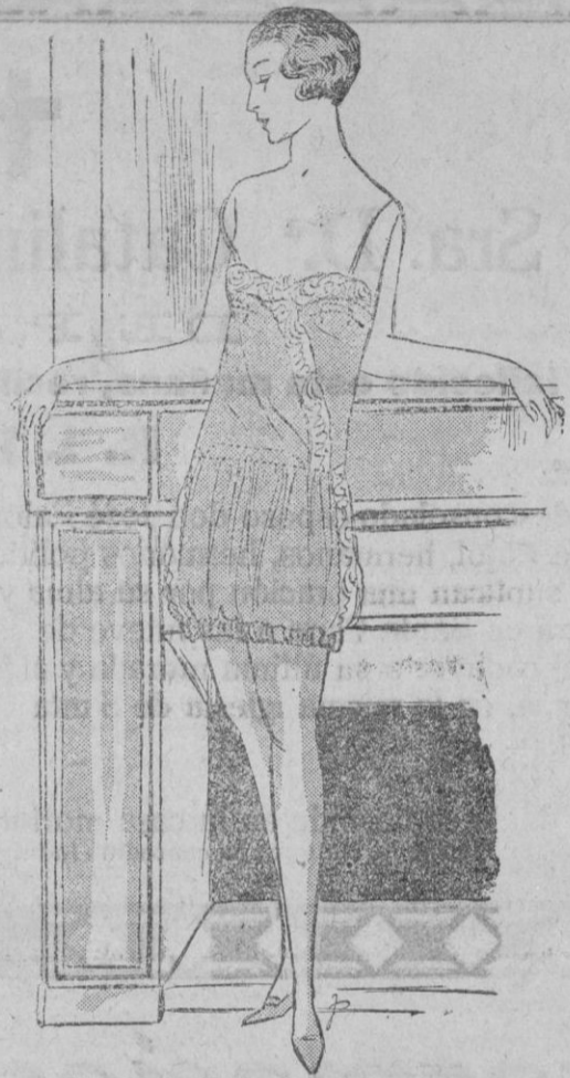
CAMISA - PANTALON.—Este modelo en crespon de China es una camisa pantalón. Está adornada con encaje de Biche, tono ocre, que encuadra el descote, sesgando la delantería y adornando los lados del pantalón. El cuerpo de la camisa es estrecho por lo alto; un volante montado sobre un «jours» y corredera facilita las piernas del pantalón.

En cuanto a la novia, antes se dejaría matar mil veces o se quedaría para vestir imágenes, que consentir en casarse sin vestido blanco, velo flotante y ramillete de azahar. Y la corte de honor de la novia, lleva esos exquisitos vestidos que saben hacerse las obreras parisienas con un retal recogido entre una montaña de ellos a la puerta de unos grandes almacenes, que poseen ese especial no se que, que es todo su atractivo y que