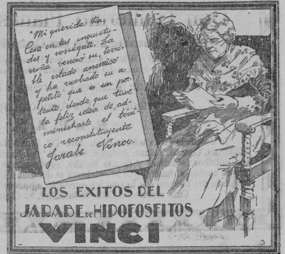
LOS EXITOS DEL JARABE DE HIPOFOSFITOS VINCI

¿Servirá de ejemplo lo sucedido en Francia para que las madres españolas desechen en absoluto tan bárbara costumbre? Es de desearlo.