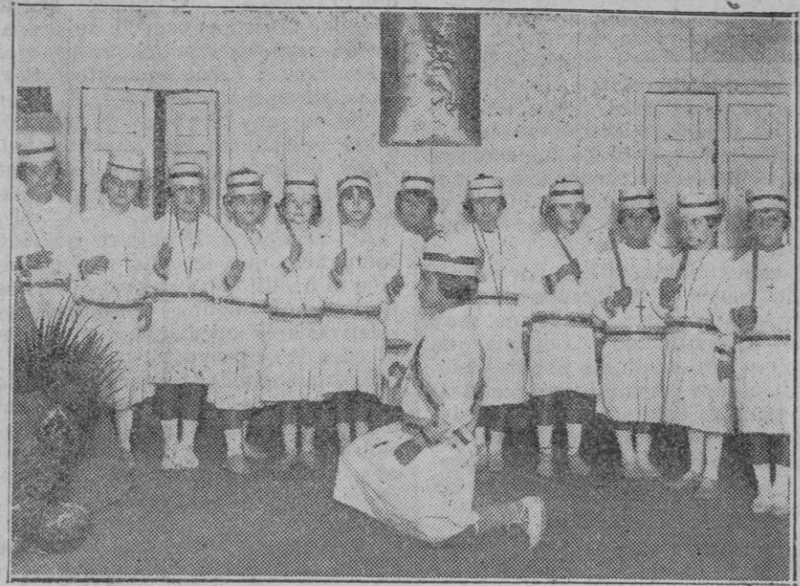
MADRID.—Velada organizada por «La Juventud Teresiana Misionera» para inaugurar el curso 1927-28. Los «Soldaditos del Niño Jesús» por las alumnas del Instituto católico femenino.

En Madrid, en cambio, los aventajados a los yanquis como coposmidores de frutas y verduras. Hemos conseguido en este terreno más que ellos. Aquí hay vendedor de esos artículos que nos rebaja el precio en un 120 por 100, o lo que es igual, nos dan gratis el género y el 20 por 100 de lo que costaba antes. A eso no han llegado los norteamericanos.