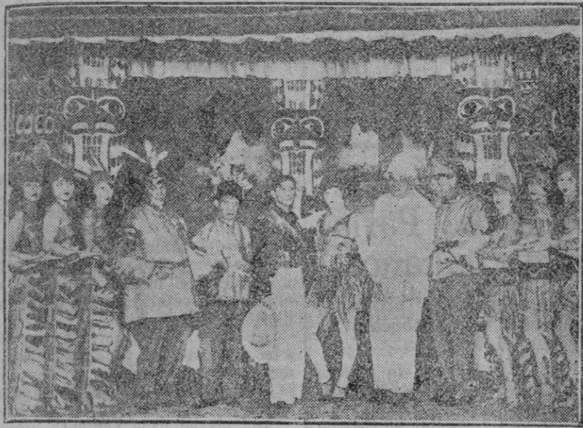
EL TEATRO EN EL EXTRANJERO VIENA.—En el teatro del Boulevard.—Una escena de la nueva ópera vienesa, «Ballo Hier Grambaum» que está obteniendo ruidoso éxito.

REDACCIÓN Y TALLERES: Calle de los Olmos, 2. ADMINISTRACIÓN: P. Cort, 30.— Teléfono n.º 6